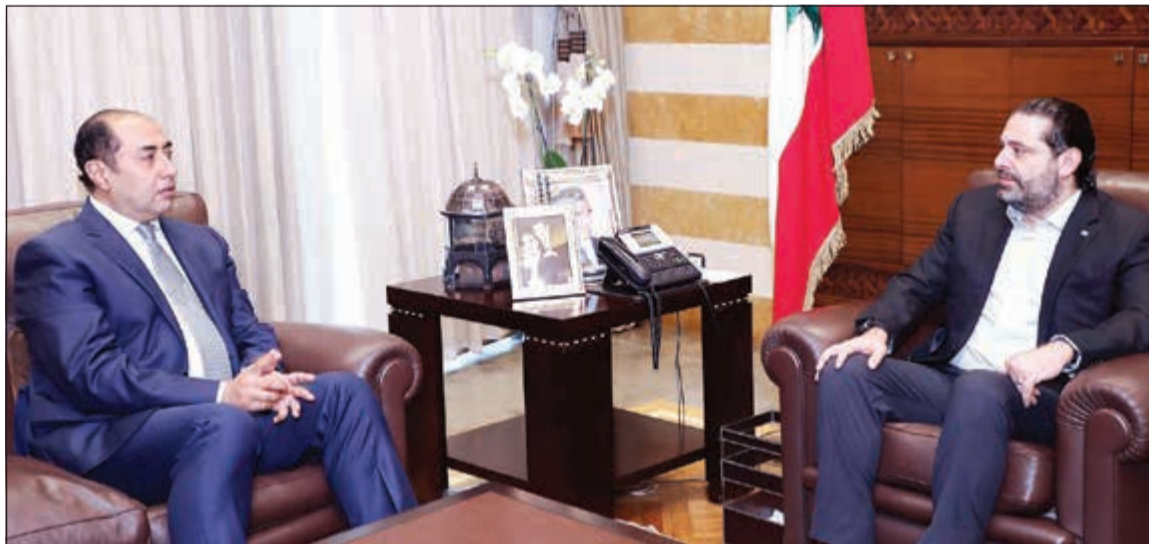
رئيس حكومة تصريف الأعمال سعد الحريري مستقبلا نائب الأمين العام لجامعة الدول العربية حسام زكي في بيت الوسط

وكرر بري أن حركة اصل وحزب الله قدما «لبن العصفور» للحريري ليرأس الحكومة، وتمت الموافقة على صيغة حكومية من 20 وزيرا بينهم 6 سياسيين على