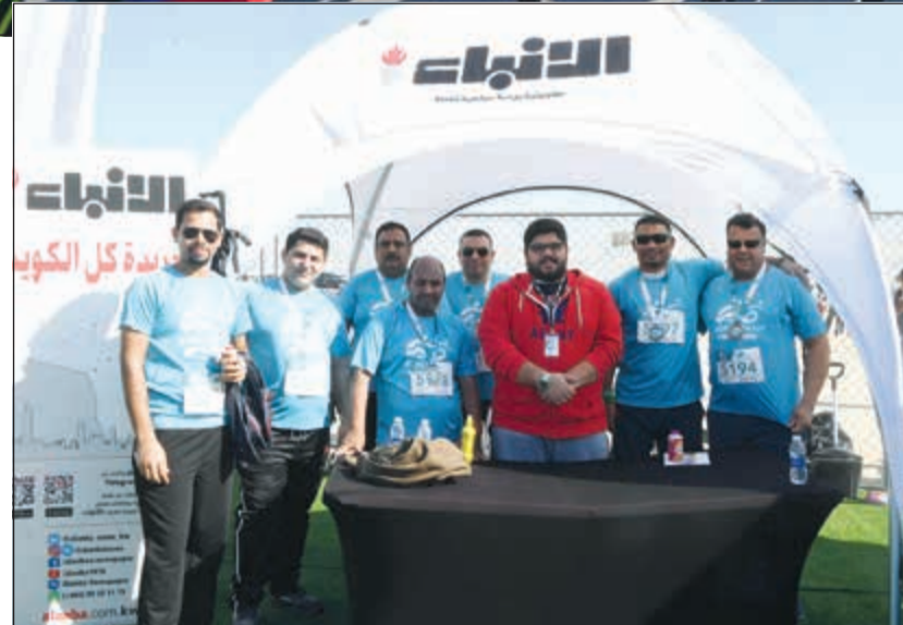
فريق عمل «الأنباء» في جناح الجريدة بماراثون مجموعة فوزية السلطان (محمد هاشم)

ختتمت مجموعة فوزية السلطان الصحية سباق RunKuwait بنجاح وبمشاركة كبيرة تخطت الـ 2600 متسابق في عامه التاسع، وذلك لدعم أهداف السباق في جمع الربيع لتوفير جلسات علاجية مجانية للأطفال من ذوي الاحتياجات الخاصة وزيادة الوعي عن احتياجاتهم الخاصة. وجمع السباق في عامه التاسع أكثر من 40 ألف دينار، وهو مبلغ سيمكن المجموعة من توفير أكثر من 500 جلسة علاجية مجانية ومن دون أي تكاليف إضافية على الأطفال من ذوي الاحتياجات الخاصة الذين سيتم علاجهم في وحدة تقييم وتأهيل الطفل غير الربحية التابع لمجموعة فوزية السلطان الصحية. كما سيساهم هذا المبلغ في تخفيف تكاليف الجلسات العلاجية بنسبة تصل إلى 90٪ بحسب تقييم الحالة الصحية والمادية للمريض. وتعليقاً على نجاح