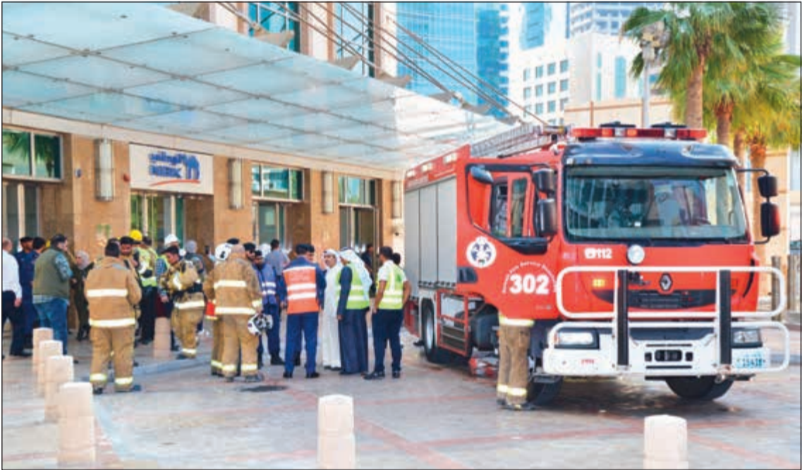
جانب من عملية الإخلاء الوهمي

حدثت الحوادث الحقيقية. وأوضحت إدارة شركة الإخلاء يأتي من واجباتها ومسؤولياتهم، وموظفيها ورواد المبنى من أجل حماية الأرواح والممتلكات، من خلال التوعية والتدريب والتأهيل الجيد بشأن كيفية التعامل مع مثل تلك الأزمات، باستخدام وسائل الحماية الذاتية وتدابير الدفاع المدني والتصرف على عمليات الإخلاء المنظم في حالات الطوارئ، كما تبين تلك التجربة حرص الإدارة على رفع مستوى الوعي الوقائي في إجراءات الأمن والسلامة لجميع المتواجدين في برج الراجة، وكيفية التعامل مع حالات الطوارئ للحد من وقوع مصابيح أثناء الأحداث، وذلك من خلال تنفيذ عملية إخلاء المبنى في أسرع وقت. ويعتبر هذا التمرين جزءا رئيسيا من خطة الطوارئ التي تضعها إدارة شركة الصاحبة العقارية لرفع كفاءة العاملين والتدريب الميداني فضلا عن اختيار كفاءة الإجراءات المتخذة من قبل العاملين والقدرة على التعامل مع الحوادث بالتعاون مع الجهات المختصة.