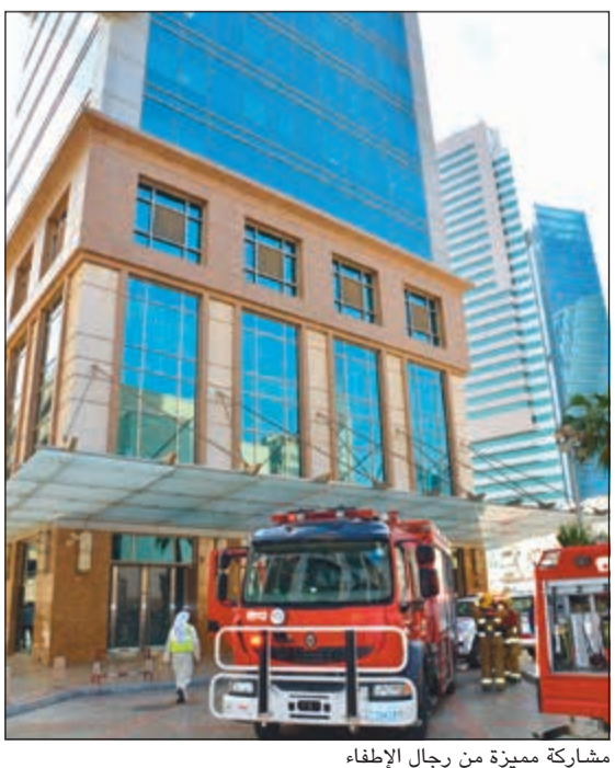
مشاركة مميزة من رجال الإطفاء

فنادقنا في الشرق الأوسط وآسيا وأوروبا». من جهته، قال مارشيلو باريكوردي، مدير عام Visa للشرق الأوسط وشمال أفريقيا: «نطمح باستمرار إلى تقديم تجارب تتخطى توقعات حاملي بطاقتنا على صعيد المكافآت الجديدة والحصرية التي تتيح لهم التمتع بتجارب ضيافة تدق حاضرة في أذهانهم. ويسعدنا توسيع شراكتنا الراسخة مع مجموعة «جميرا» لإطلاق المزيد من التجارب الاستثنائية لحاملي بطاقتنا عبر وجهات «جميرا» الساحرة. وسنعمل معا على تمكين حاملي بطاقتنا من التعرف على روح Visa من التعرف على روح الضيافة العريقة التي تشتهر بها منطقة الشرق الأوسط عموما ودولة الإمارات العربية المتحدة خصوصا».