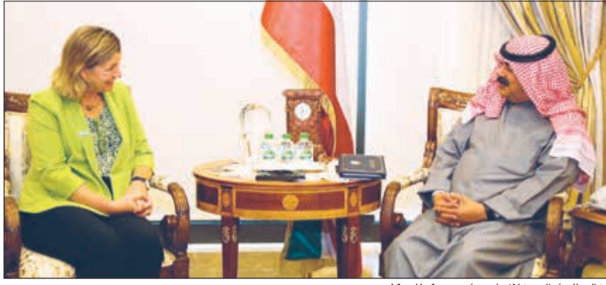
خالد الجارالله خلال اجتماعه مع كيلي كليمنتس

عضويته مساعد وزير الخارجية لشؤون الوطن العربي السفير فهد العوضي ومساعد وزير الخارجية لشؤون مكتب نائب الوزير السفير أيهم العمر.