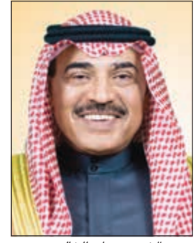
سمو الشيخ صباح الخالد

وتمن سمو رئيس مجلس الوزراء الشيخ صباح الخالد طيب المشاعر الصادقة والتواصل الأخوي الذي يعكس عمق العلاقات بين البلدين، كما تمنى دولة رئيس مجلس الوزراء عادل عبدالمهدي للكويت المزيد من التقدم والازدهار تحت ظل القيادة الحكيمة لصاحب السمو الامير الشيخ صباح الاحمد.