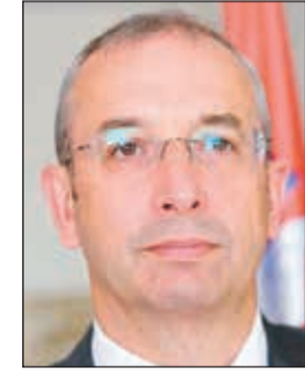
السفير مايكل دافنبورت

حجم التجارة الثنائية 4,5 مليارات دولار خلال العام الماضي. وأشار إلى أنه تم إنشاء مكتب أول صندوق استثمار عربي في بريطانيا في مطلع خمسينيات القرن الماضي، والذي ساهم في تنمية الاستثمارات في بريطانيا كما ساهم أيضاً في تنمية الاقتصاد البريطاني. وتابع بيهاني أن بريطانيا تشكل واحدة من أفضل الوجهات العلمية للطلاب الكويتيين بأكثر من 6500 طالب، بالإضافة إلى أن أكثر من 200 ألف كويتي يزورون بريطانيا سنوياً. كما أن هناك 10 آلاف بريطاني يعيشون ويعملون على أرض الكويت وتستفيد منهم الكويت في مجالات مختلفة.