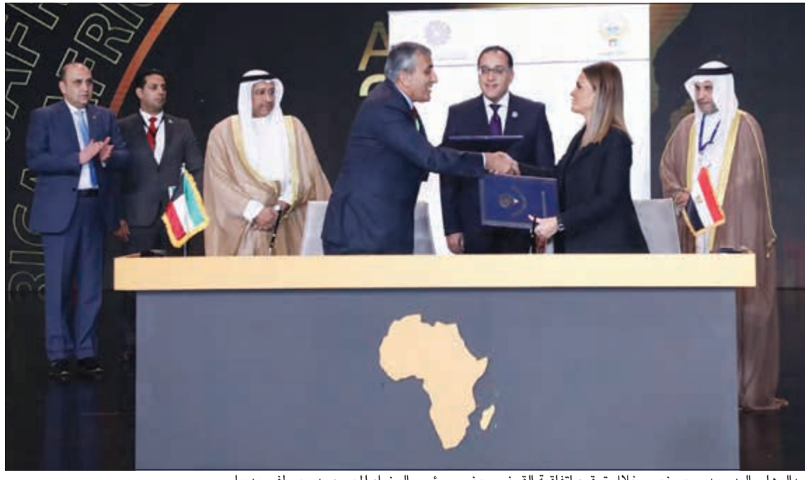
عبدالوهاب البدر ود.سحر نصر خلال توقيع اتفاقية القرض بحضور رئيس الوزراء المصري د. مصطفى مدبولي

البدري: «الصندوق الكويتي» مؤل مشاريع في أفريقيا بـ 4 مليارات دولار أكد المدير العام للصندوق الكويتي للتنمية الاقتصادية العربية عبدالوهاب البدر أن الصندوق ساهم في تمويل 324 مشروعاً منها تمويل لنحو 42 دولة أفريقية غير عربية بإجمالي قروض 4 مليارات دولار، وتبلغ منها حصة القروض الموجهة لقطاع النقل 2,2 مليار دولار بمعدل 75,4٪. وذكر أن دول القارة السمراء مليئة بالموارد ولكن المطلوب هو كيفية حشد هذه الموارد من خلال التعليم والاتصالات. وقال البدر خلال جلسة افتق الاستثمار العربي-الأفريقي المشترك في ظل اتفاقية التجارة الحرة الأفريقية، التي عقدت خلال مؤتمر أفريقيا 2019، أن المطلوب من دول القارة الإفريقية أن توفر الفرص الاستثمارية بوضوح في تلك الدول لتشجيع واستقطاب المستثمرين في المشروعات المختلفة، وأضاف البدر أن إجمالي مساعدات المجموعة العربية ما يفوق 100 مليار دولار للقارة الأفريقية. وأعلن البدر أن هناك الحاجة إلى الإعلام للقيام بدوره في إلقاء الضوء حول الفرص ومزايا الاستثمار في الدول الأفريقية، خاصة أن الكثير من المستثمرين لا يعرفون الكثير عن تلك الفرص والمزايا. وشهدت الجلسة إطلاق المؤسسة الإسلامية الدولية لتمويل التجارة مبادرة الجسور التجارية العربية-الأفريقية بالتعاون مع البنك الأفريقي للتصدير والاستيراد (AFREXIMBANK) ووكلات التنمية الدولية والإقليمية والوطنية والمؤسسات المالية. ويهدف المشروع إلى التصدي للتحديات التي تحول دون استفادة مجتمع الاستثمار والتجارة في البلدان العربية والأفريقية من الفرص الاستثمارية والتجارية القائمة داخل المنطقتين. كما ناقشت الجلسة فوائد تعزيز التكامل والتعاون والاستفادة من إمكانات الاستثمار والتجارة بين الدول الأفريقية والعربية.