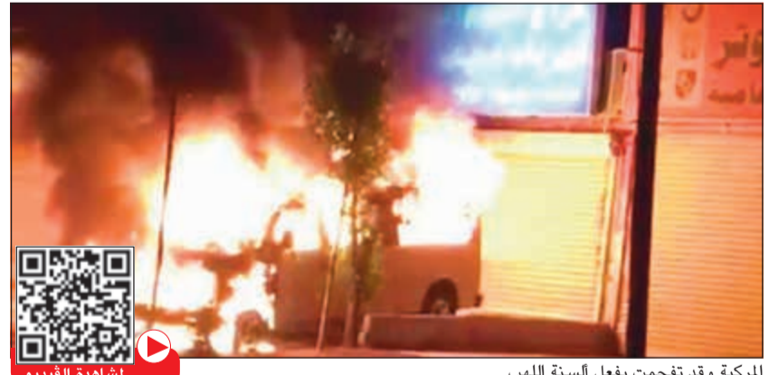
المركبة وقد تغمطت بفعل السنة للهب

على مركبة أثناء توقفها أمام أحد الكراجات في «صناعية الجهراء» أمس الأول. وتعامل