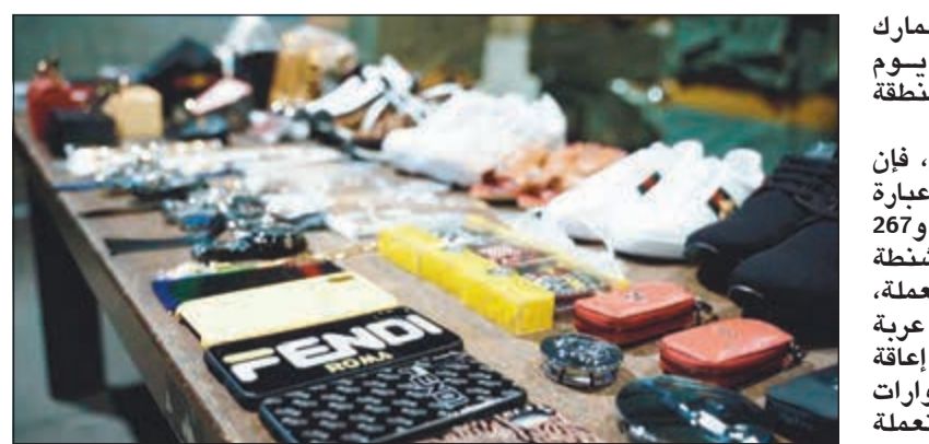
صورة أرشيفية لمضبوطات من قبل «الجمارك» قد تعرض في المزاد

«الجمارك» تتجه لبيع 1980 كروز سجائر وساعات وعربات أطفال وإعاقه في مزاد علني