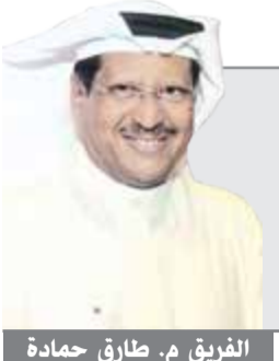
الفريق م. طارق حمادة