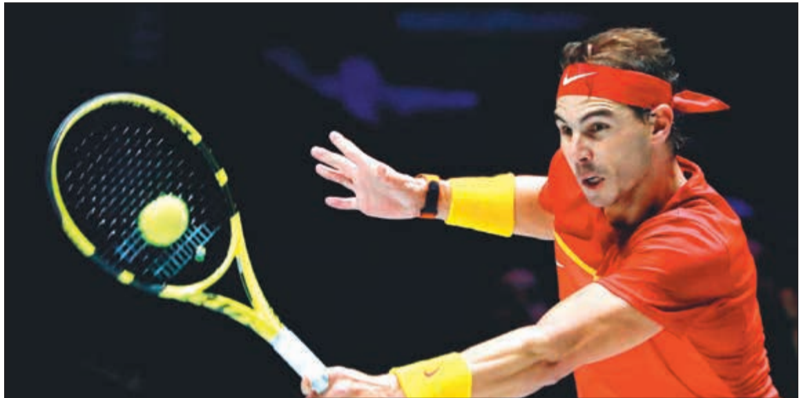
رافاييل نادال يتألق مع منتخب بلاده في البطولة

و6-2، وفوز مواطنه فيليب كرايوفيتش على يويتشي سوجيتا 6-2 و6-4.