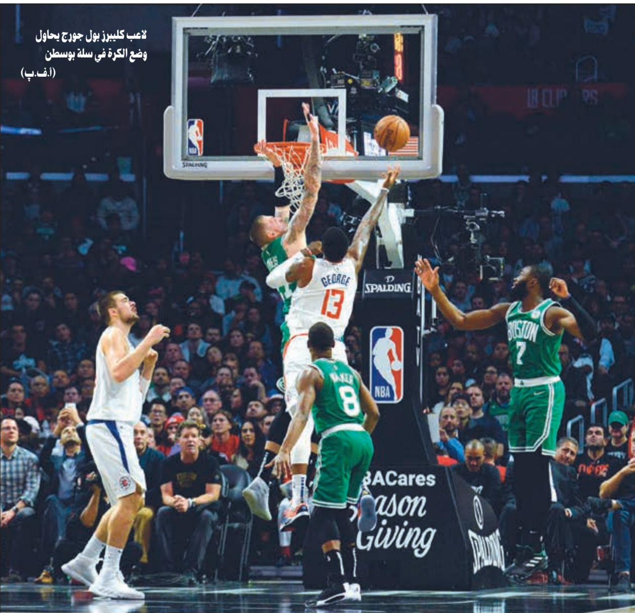
لاعب كليبيرز بول جورج يحاول وضع الكرة في سلة بوسطن (أضرب)

وفي الثانية على ملعب «أميريكان إيرلاند سنتر» وأمام 19569 متفرجا، قاد صانع ألعاب السلوفيني الواعد لوكا دونستيتش (20 عاما) فريقه دالاس مافريكس إلى