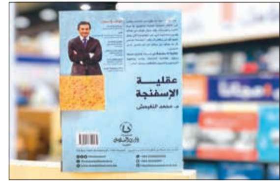
الغلاف الخلفي لكتاب عقلية الإسفنجية

إدارية مرتبطة بأجديات إدارة اجتماعات العمل والتعامل مع صعي المراس من المشاركين فيها». وقال إن الإصدارين «كتبا بطريقتة تجعلهما صالحين للقراءة في كل زمان ومكان لأنهما يتناولان مفاهيم إدارية واجتماعية عميقة في قالب مبسط ومنتج لجميع فئات القراء». ويتوافر «عقلية الإسفنجية» في مكتبة ذات السلاسل أما «لماذا نكره الاجتماعات؟» فيعرض في مكتبة ضحى في القاعة رقم 6 بمعرض الكويت الدولي للكتاب في منطقة مشرف. وسيقيم حفلا لتوقيع الكتاب السبت 23 نوفمبر في الساعة الثامنة مساء، وحفلا آخر في تمام السادسة مساء في مكتبة ضحى في القاعة نفسها.