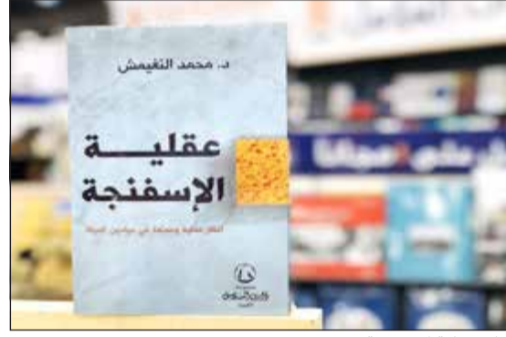
كتاب عقلية الإسفنجية

كما أصدر كتابه السادس بعنوان «لماذا نكره الاجتماعات؟» وفيه حلول لمشكلات تفور الناس من اللقاءات الاجتماعية الخاصة والرسمية. وقال د. النغميش إن «عقلية الإسفنجية» هي محاولة لتقديم موضوعات متنوعة «انبعثت ما تكون عن المثاليات وأقرب إلى الأفكار العملية القابلة للتطبيق في حياة الأفراد والمؤسسات». مشيرا إلى أن الكتاب «يركز على الإنسان وذلك لأن معظم الكتاب مشغولون في المشكلات المحيطة به ويفقدون عن تسليط الضوء على الفرد نفسه الذي يعد عنصرا أساسيا في كيفية مواجهة المشكلات التي تعترضه». ولهذا السبب قال «إن الأدبيات الإدارية التي تدرس في الجامعات صارت تفرّد مساحات كبيرة للإنسان أو العلوم الاجتماعية والنفسية التي امتزجت امتزاجا كبيرا مع علم الإدارة الحديث». ووصف الكتاب، الذي جاء