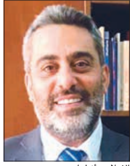
الإعلامي أنطوان سعد