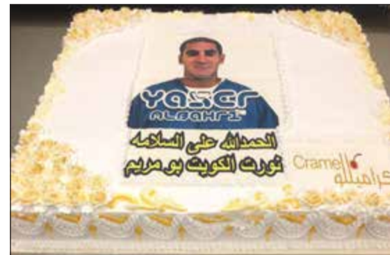
كعكة احتفاء بعودة البحري

«العنصرية»، متبيرة إلى أن التهمة التي وجهت له يعاقب عليها القانون هناك بالحبس 5 سنوات إلا أنه نال عقوبة الحبس 15 عاماً. وتوجهت فاطمة بالشكر