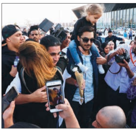
لهفة وشوق.. ودموع فرح