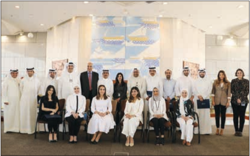
صورة جماعية للمشاركين في البرنامج التدريبي