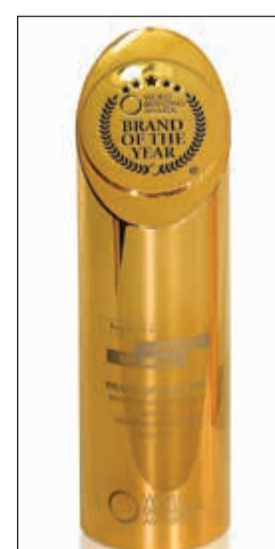
جائزة أفضل علامة تجارية للأقيوز