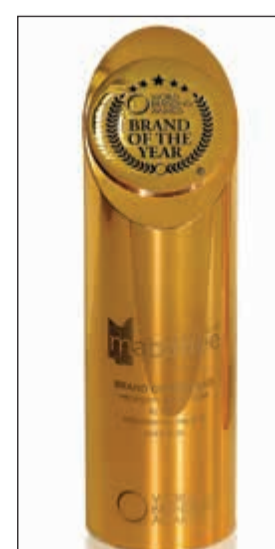
أفضل علامة تجارية لشركة المباني