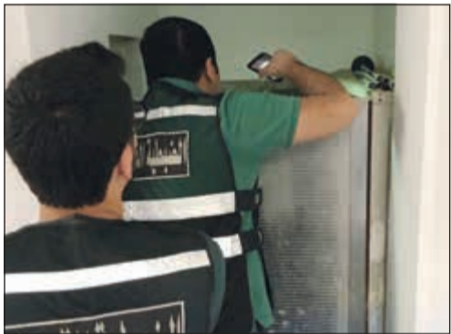
جانب من قطع التيار عن مساكن العزاب بحولي

في إطار الجهود المتواصلة التي تبذلها البلدية لتطبيق القوانين واللوائح وخاصة في مجال مكافحة سكن العزاب في مناطق السكن الخاص والنموذجي، قامت إدارة التدقيق والمتابعة الهندسية في بلدية حولي بقطع التيار الكهربائي عن سكن العزاب في مناطق: بيان، الرميثية، سلوى، السالمية، والجابرية بالتعاون مع وزارة الكهرباء والماء وبمساعدة من قوات الأمن.