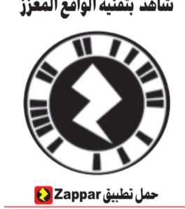
حمل تطبيق Zappar