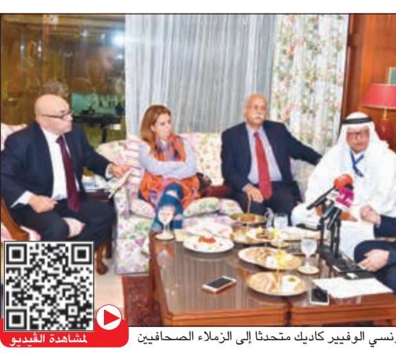
السيناتور الفرنسي الوفير كاديك يتحدث إلى الزملاء الصحفيين