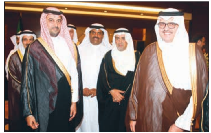
سفير السعودية الأمير سلطان بن سعد وسفير قطر بندر العليوية وعدد من الحضور

الفرغم من كل ظروف الاحتلال والقمع الذي يعانيه الشعب الفلسطيني في دولة فلسطين المحتلة. ان هذه العلاقة جذورها ضاربة في الأرض كشجرة زيتون فلسطينية شامخة بالسما والشمس كشجرة نخيل كويتية سنستمر في بنائها وتطويرها انطلاقا من إيمان قبادتي البلدين الشقيقين وعلى رأسهما الرئيس محمود عباس رئيس دولة فلسطين وأخوه صاحب السمو الأمير الشيخ صباح الأحمد، مشير إلى أن العلاقات بين البلدين جذورها في الأرض وقرعها بالسماء.