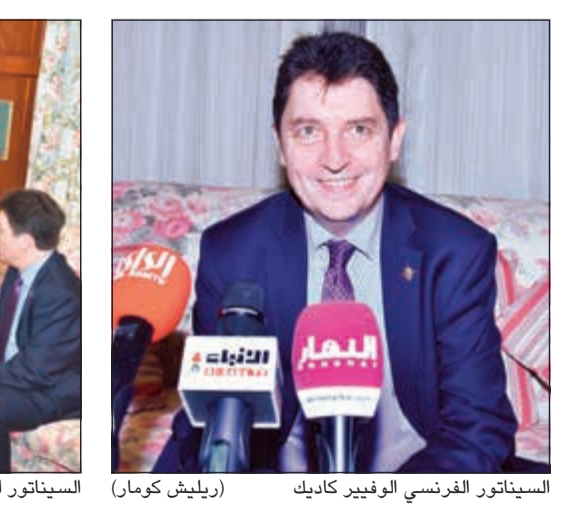
السيناتور الفرنسي الوفير كاديك (روليش كومار)

أساد السيناتور الفرنسي الوفير كاديك بعمق ومثانة العلاقات الفرنسية - الكويتية، مؤكدا أن بلاده قريبة جدا من الكويت وعلاقتها الثنائية نموذجية، مشددا على التزام بلاده بأمن الكويت أكبر دليل على ذلك وجود الضباط الفرنسيين على أرضها. وشدد خلال مؤتمر صحفي عقده في فندق الشيراتون على هامش زيارته للبلاد - على ان صورة الكويت لدى الفرنسيين جميلة جدا وشافة، مشيرا الى أن زيارته الثانية للبلاد خلال خمس سنوات تحمل العديد من الدلالات والمضامين الهامة في شتى المجالات، فعلى الصعيد البرلماني، ذكر أن الزيارة تأتي توطيدا للعلاقات البرلمانية بين البلدين وكنوع من المتابعة للزيارة التي قام بها رئيس مجلس الشيوخ الفرنسي جيرار لارشيه للبلاد في بداية هذا العام والتي كانت ناجحة بكل المقاييس.