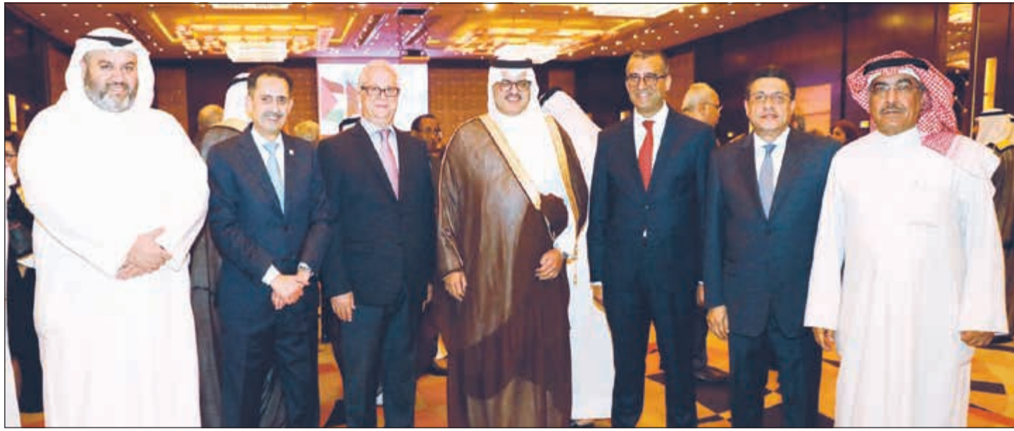
نائب رئيس التحرير الزميل عدنان الراشد مع سفراء مصر طارق القوني وتونس أحمد بن الصغير والسعودية الأمير سلطان بن سعد والمغرب جعفر حكيم والأردن صقر أبوشتال والزميل عبدالرحمن العليان