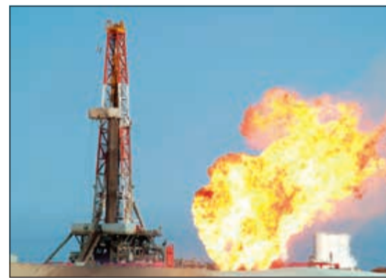
خفص حرق الغاز لمستويات قياسية

وقدمت شركتان أخريان عرضين للمشروع هما شركة اتحاد المقاولين اللبنانية CCC بقيمة بلغت 292 مليون دينار، وشركة انفسست للتجارة العامة والمقاولات بقيمة 223 مليون دينار. تجدر الإشارة إلى أن وزارة الأشغال العامة عند إصدارها في يناير مناقصة