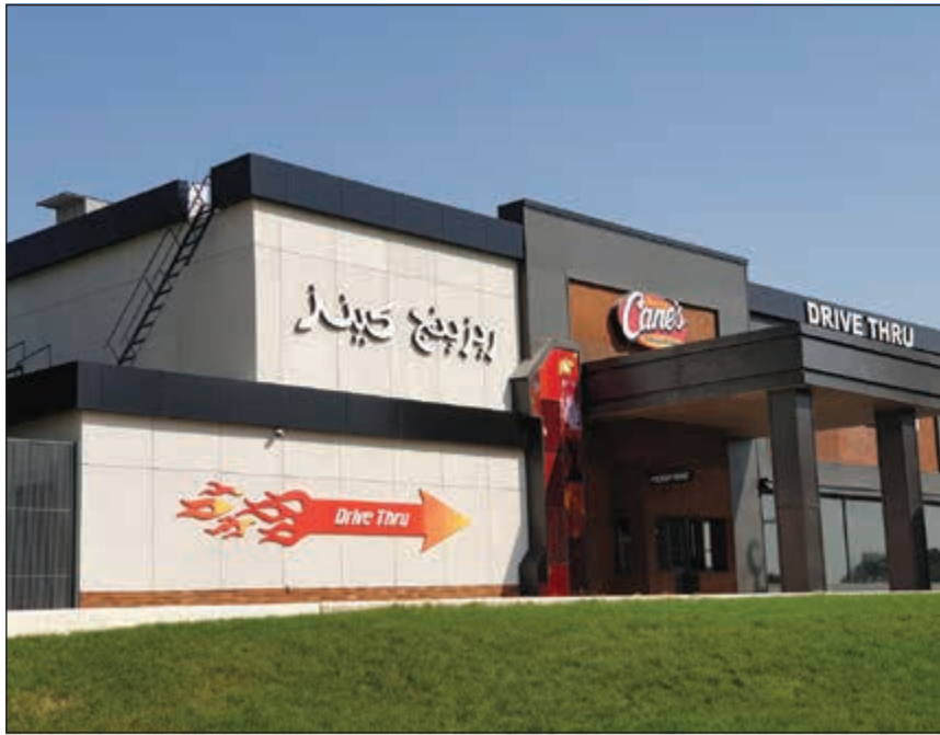
درايف ثرو زكائن وريزينج كينز