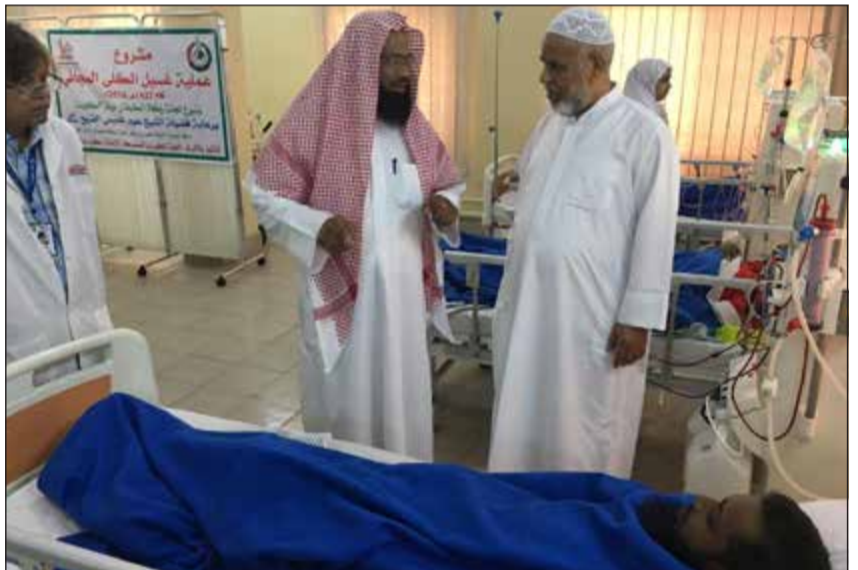
علاج المرضى إحدى أهم أولويات الجمعية