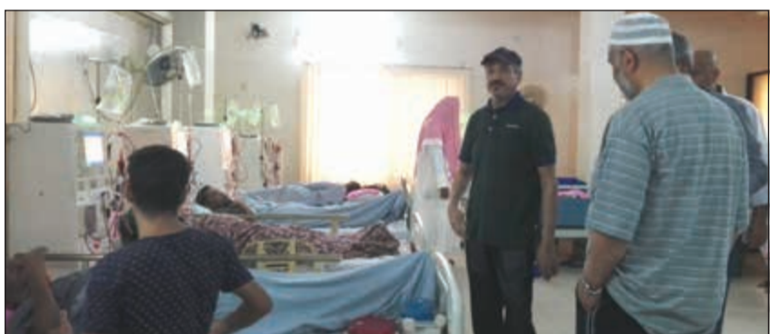
جانب من الزيارات التقديرية للمرضى

لها. لذلك توضع النجاة الخيرية ملف علاج المرضى ضمن أهم أولوياتها. ولدعم هذه المراكز والمساهمة في كفاءة المرضى وشراء الأجهزة الاتصال على 1800082 أو زيارة حسابات الجمعية عبر شتى منصات التواصل الاجتماعي.