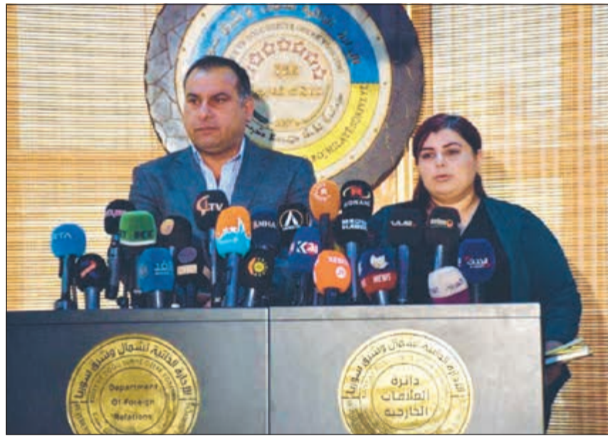
جانب من المؤتمر الصحافي لممثلي الإدارة الذاتية الكردية

وكالات: ناشد الأكراد، الذين يسيطرون على ما يسمى «الإدارة الذاتية» في شمال سورية، الحكومة السورية تطوير لغة الحوار. وقالت الإدارة الخاضعة لسيطرة قوات سوريا الديموقراطية (قسد) إنه لم يكن لديها يوماً أي هدف لتقسيم سورية، رغم اتهامها بإقامة حكم ذاتي بحكم الأمر الواقع والسعي للانفصال في المناطق التي خضعت لسيطرتها وتطلق عليها بالكردية «روج آفا» وتعني إقليم غرب كردستان. وأضافت، في بيان، نقلته وكالة «هاوار» الكردية، «تناشد الإدارة الذاتية الحكومة السورية تطوير لغة الحوار والتوافق معنا، فحنن