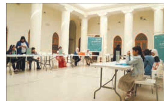
جانب من ورش العمل لأطفال «بيتي»

ينظم بيت التمويل الكويتي (بيتك) برنامج «المرح مع النسيج» بالتعاون مع بيت السدو لعملاء حساب «بيتي» الموجه إلى الأطفال، بغرض تعميق الرؤية للتراث لدى أجيال المستقبل، وتعريف الأبناء وتدريبهم على فنون الحرف اليدوية خاصة فن النسيج، بما يؤكد اهتمام «بيتك» بإحياء التراث وتحقيق الترابط بين الأجيال، وذلك ضمن شراكة استراتيجية مع «بيت السدو».