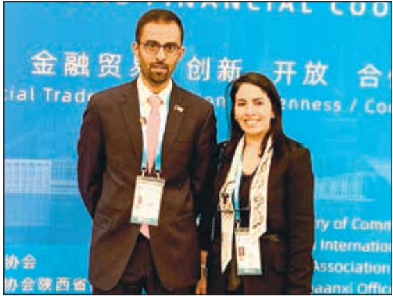
الريميح خلال مشاركتها في المنتدى