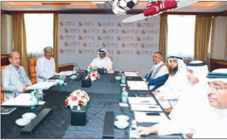
جانب من اجتماع المكتب التنفيذي لكأس الخليج العربي

للإعلان عن موافقة مشاركة اتحادات الدول الثلاث في النسخة الجديدة إلى منتخبات الكويت والعراق واليمن وسلطنة عمان وقطر (المستضيف)، كما قرر إجراء سحب قرعة جديدة في 6:30 مساء اليوم، والتي ستقام بنظام المجموعتين بعدما كان من المنفق عليه أن تجري بنظام الدوري من دور واحد قبل إعلان الدول الثلاث مشاركتها. كما قرر اتحاد كأس الخليج العربي تأجيل موعد انطلاق «خليجي 24»، من 24