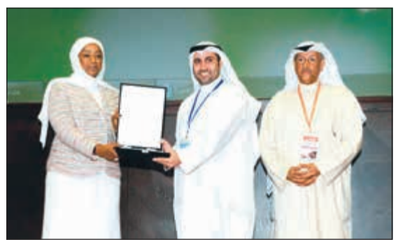
تكريم البدر من قبل وزارة الشؤون

من أبناء الجالية السورية من هذا المشروع، حيث استفاد من هذا المشروع أكثر من 1717 طالباً وطالبة والذين بفضل الله حققوا درجات عليا والتحقوا بالعديد من الجامعات المرموقة في شتى التخصصات. مؤكداً أن النجاة الخيرية لديها داخل الكويت 15 مدرسة وبقية مميزة، يستفيد من خدماتها التعليمية أكثر من 12 ألف طالب علم من شتى الجنسيات، ويتفوق من الله جل وعلا ثم بجهود طاقم العاملين في هذا الحقل التعليمي الرائد تحقق مدارس النجاة المراكز الأولى على مستوى الكويت في شتى المراحل الدراسية، حتى غدت عنواناً للريادة التعليمية داخل الكويت.