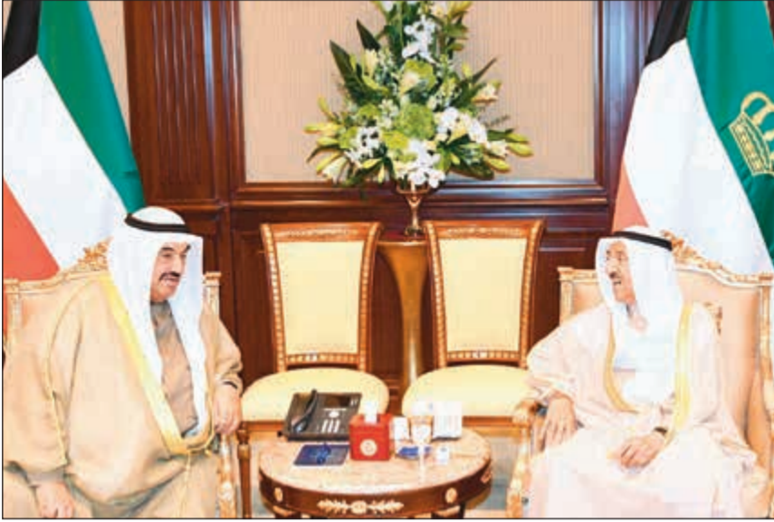
صاحب السمو الأمير مستقبلاً سمو الشيخ ناصر المحمد