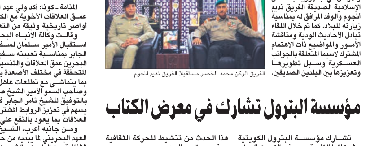
الفريق الركن محمد الخضر مستقبلاً الفريق نديم أنجوم

المنامة - كونا: أكد ولي عهد البحرين الأمير سلمان بن حمد عمق العلاقات الأخوية مع الكويت وما يربط بين البلدين من أواصر تاريخية وثيقة من التعاون والتنسيق المشترك. وقالت وكالة الأنباء البحرينية (بنا) أن ذلك جاء خلال استقبال الأمير سلمان لسفيرنا لدى البحرين الشيخ ثامر الجابر بمناسبة تعيينه سفيراً لدى المملكة. وأكد ولي عهد البحرين عمق العلاقات والتنسيق المشترك التي عززتها المنجزات المتحققة في مختلف الأصعدة بين البلدين والشعبين الشقيقين بما يتماشى مع تطلعات أهل البحرين الملك حمد بن عيسى وصاحب السمو الأمير الشيخ صباح الأحمد، وأعرب عن تهنأته بالتوفيق للشيخ ثامر الجابر في أداء مهامه الدبلوماسية بما يسهم في تعزيز الروابط المشتركة وفتح مجالات أرحب لتوطيد العلاقات بما يعود بالنفع على البلدين والشعبين الشقيقين. ومن جانبه أعرب، الشيخ ثامر الجابر عن شكره لولي العهد البحريني لما يبديه من حرص واهتمام لتوطيد العلاقات الثنائية بين البلدين والشعبين الشقيقين.