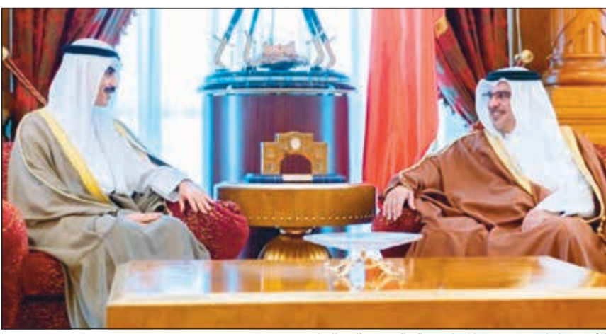
الأمير سلمان بن حمد خلال استقباله السفير ثامر الجابر

المنامة - كونا: أكد ولي عهد البحرين الأمير سلمان بن حمد عمق العلاقات الأخوية مع الكويت وما يربط بين البلدين من أواصر تاريخية وثيقة من التعاون والتنسيق المشترك. وقالت وكالة الأنباء البحرينية (بنا) أن ذلك جاء خلال استقبال الأمير سلمان لسفيرنا لدى البحرين الشيخ ثامر الجابر بمناسبة تعيينه سفيراً لدى المملكة. وأكد ولي عهد البحرين عمق العلاقات والتنسيق المشترك التي عززتها المنجزات المتحققة في مختلف الأصعدة بين البلدين والشعبين الشقيقين بما يتماشى مع تطلعات أهل البحرين الملك حمد بن عيسى وصاحب السمو الأمير الشيخ صباح الأحمد، وأعرب عن تهنأته بالتوفيق للشيخ ثامر الجابر في أداء مهامه الدبلوماسية بما يسهم في تعزيز الروابط المشتركة وفتح مجالات أرحب لتوطيد العلاقات بما يعود بالنفع على البلدين والشعبين الشقيقين. ومن جانبه أعرب، الشيخ ثامر الجابر عن شكره لولي العهد البحريني لما يبديه من حرص واهتمام لتوطيد العلاقات الثنائية بين البلدين والشعبين الشقيقين.