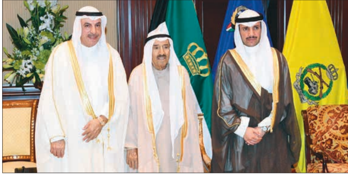
صاحب السمو الأمير الشيخ صباح الأحمد مستقبلاً مرزوق الغانم وفيصل الشايح