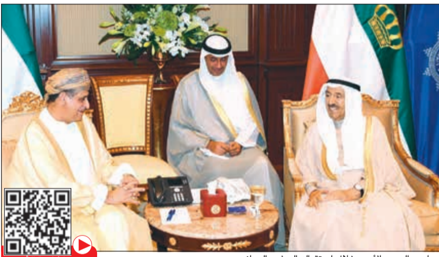
صاحب السمو الأمير خلال استقباله السفير العماني