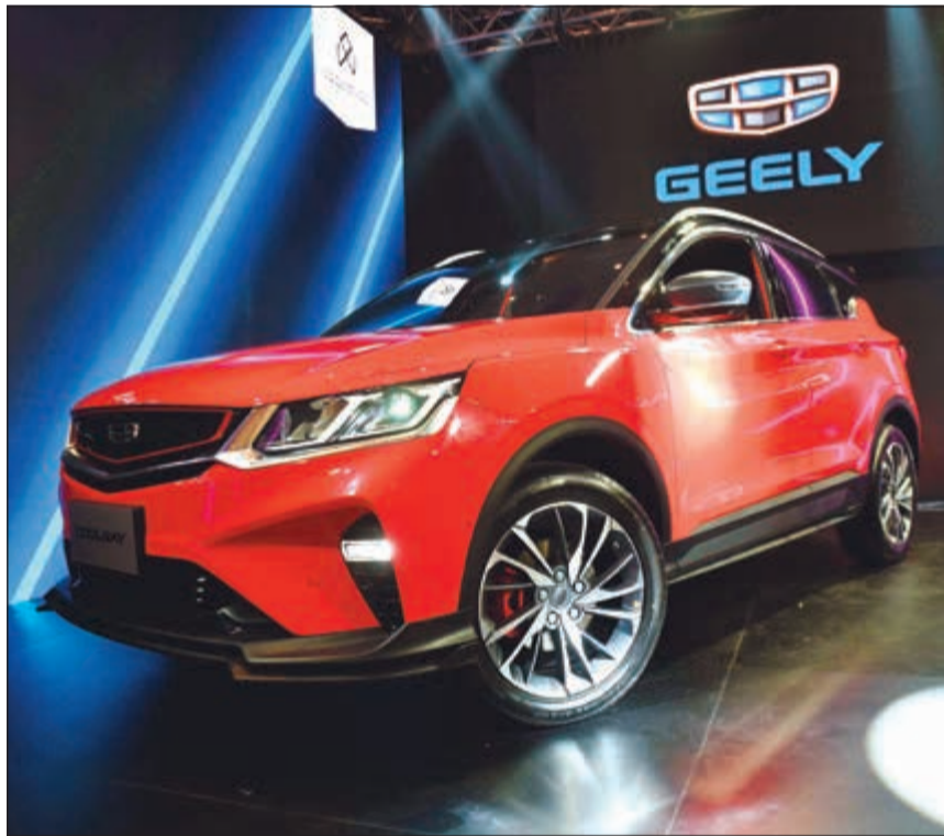
«جيلي كول راي» الجديدة كلياً (متمين غوزال)

■ نان: منتجنا تمتلك تكنولوجيا خاصة بها على مستوى عالٍ جداً من التطور ■ شوانهي: «كول راي» الجديدة كلياً تعتبر ثمرة تعاون مجد بين «جيلي» و«فولفو»