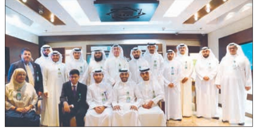
لقطة جماعية لبعض المعينين مع مسؤولي «بيتك»

افتتح بيت التمويل الكويتي (بيتك) برنامجاً تدريبياً متكاملًا لتأهيل مجموعة من المعينين الجدد لبدء مهام عملهم في القطاع المصرفي، ضمن حرص «بيتك» على استقطاب وتدريب الطاقات الشبابية الكويتية، ورفع كفاءتهم لمواجهة متطلبات العمل التي يركز من خلالها البنك على المنافسة والارتقاء في خدمة العميل، بما يؤكد ريادته في تقديم أرقى الخدمات والمنتجات المصرفية.