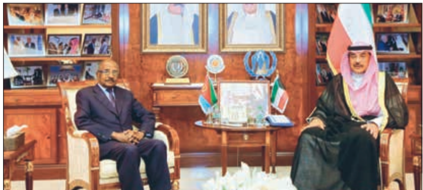
الشيخ صباح الخالد خلال استقباله عثمان محمد

القضايا محل الاهتمام المشترك. حضر الاجتماع نائب وزير الخارجية خالد الجارالله ومساعد وزير الخارجية لشؤون مكتب نائب رئيس مجلس الوزراء ناصر الحمد ومساعد وزير الخارجية لشؤون المراسم السفير ضاري العجران ومساعد وزير الخارجية لشؤون مكتب نائب وزير الخارجية السفير ايهب العمر ومساعد وزير الخارجية لشؤون أفريقيا الوزير المفوض حمد المشعان وعدد من كبار المسؤولين بوزارة الخارجية.