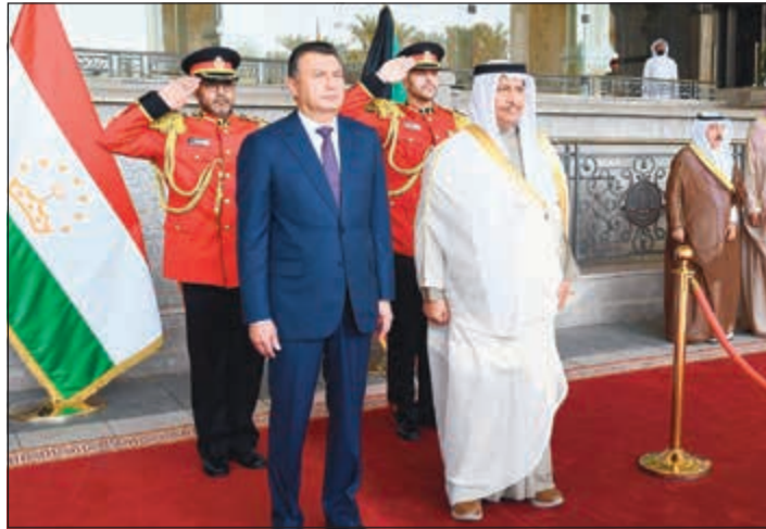
سمو رئيس الوزراء الشيخ جابر المبارك خلال استقباله رئيس وزراء طاجيكستان قاهر رسول زاده