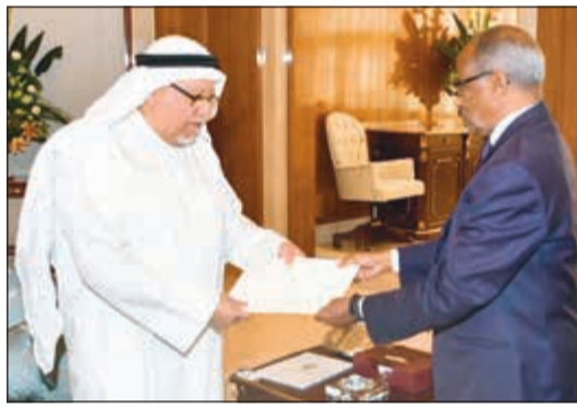
الشيخ علي الجراح يتسلم رسالة خطية من وزير الشؤون الخارجية لدولة إريتريا

تسلم صاحب السمو الأمير الشيخ صباح الأحمد رسالة خطية من أخيه الرئيس عثمان غزالي رئيس جمهورية القمر المتحدة الشقيقة، تتعلق بالعلاقات الثنائية التي تربط البلدين والشعبين الشقيقين، وسبل تنميتها وتعزيزها في المجالات كافة. وقد قام بتسليم الرسالة لوزير شؤون الديوان الأميري الشيخ علي الجراح وزيرة الصحة والتضامن والحماية الاجتماعية وتعزيز المساواة بين الجنسين لجمهورية القمر