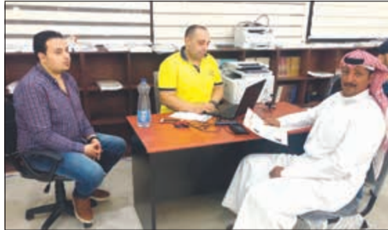
تسجيل أحد المتسابقين