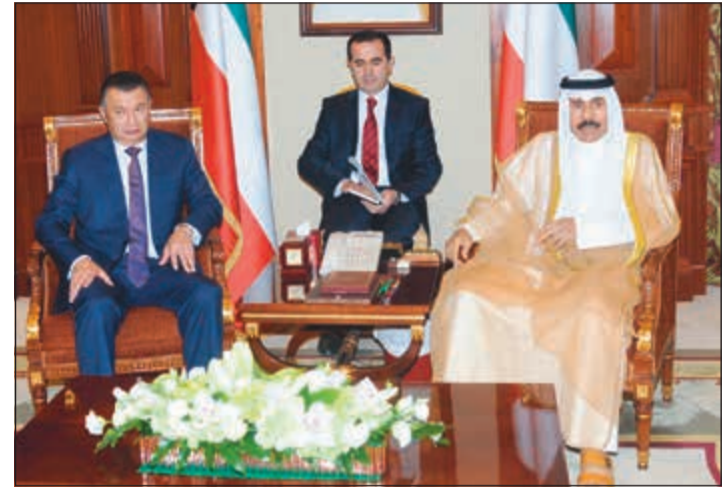
سمو ولي العهد الشيخ نواف الأحمد خلال استقباله رئيس وزراء طاجيكستان قاهر رسول زاده

عقب ذلك صافح الضيف كبار مستقبليه وفي مقدمتهم نائب رئيس مجلس الوزراء ووزير الخارجية الشيخ صباح الخالد ونائب رئيس مجلس الوزراء ووزير الداخلية الشيخ خالد الجراح والمستشار في ديوان رئيس مجلس الوزراء رئيس بعثة الشرف المرافقة الشيخ د.سالم الجابر وعدد من الشيوخ وكبار قادة الجيش