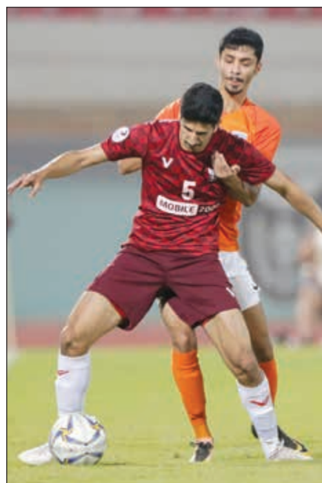
النصر قدم أداء متزنا في مواجهة كاظمة