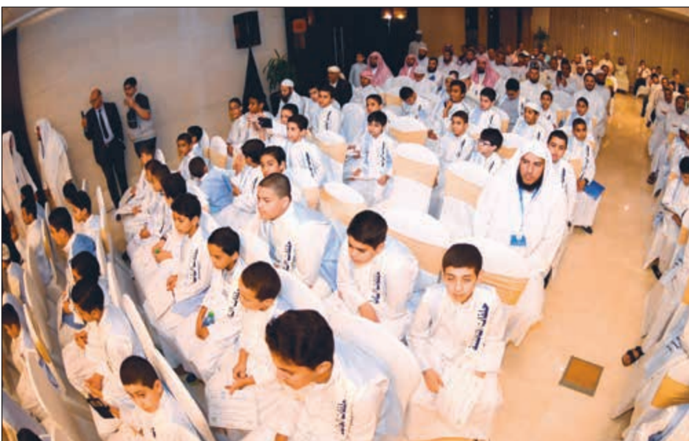
يوم تكريم البراعم