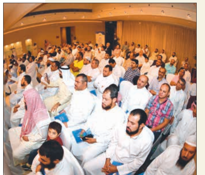
حضور كبير من اولياء الامور