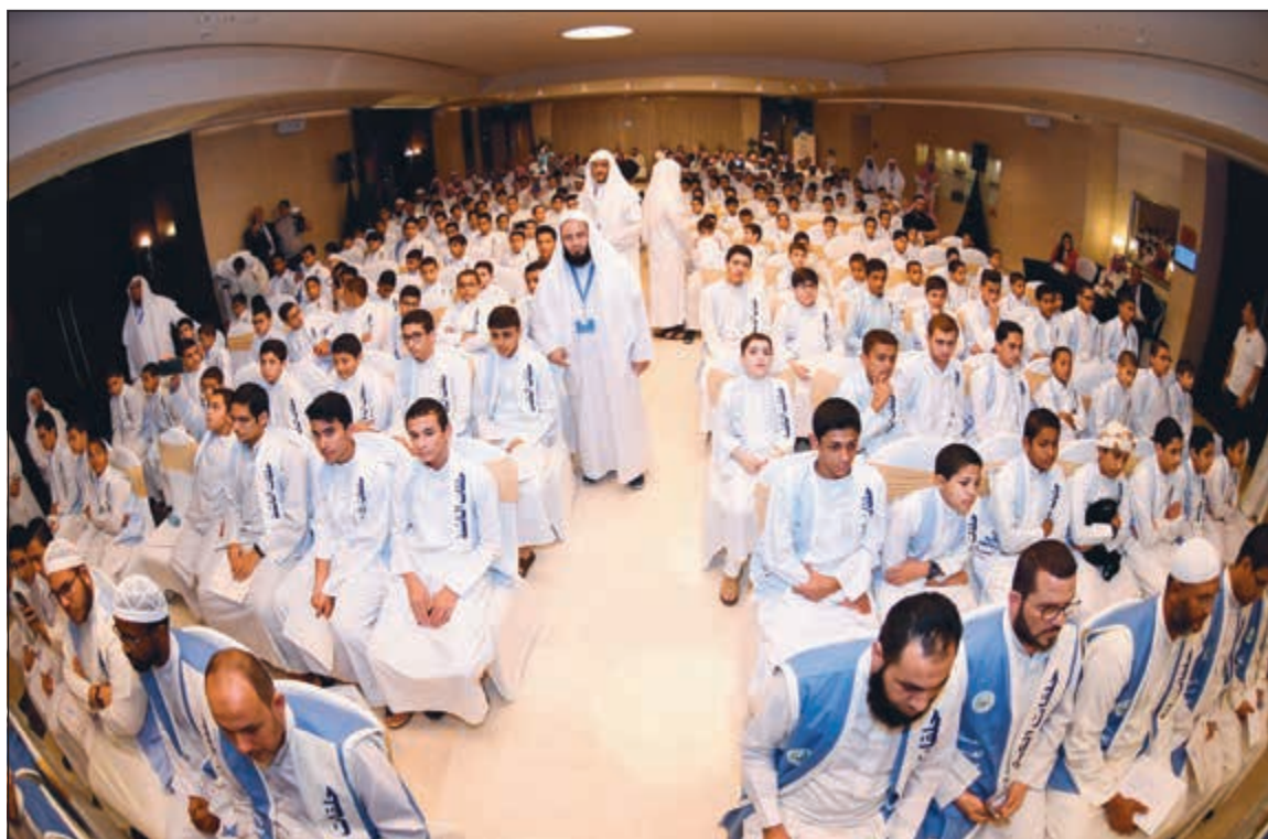
حضور حاشد من الحفظة