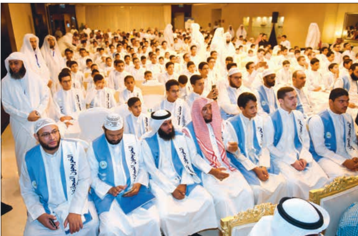
الخريجون الجازون بالسند المتصل يتصدرون الحضور الكبير