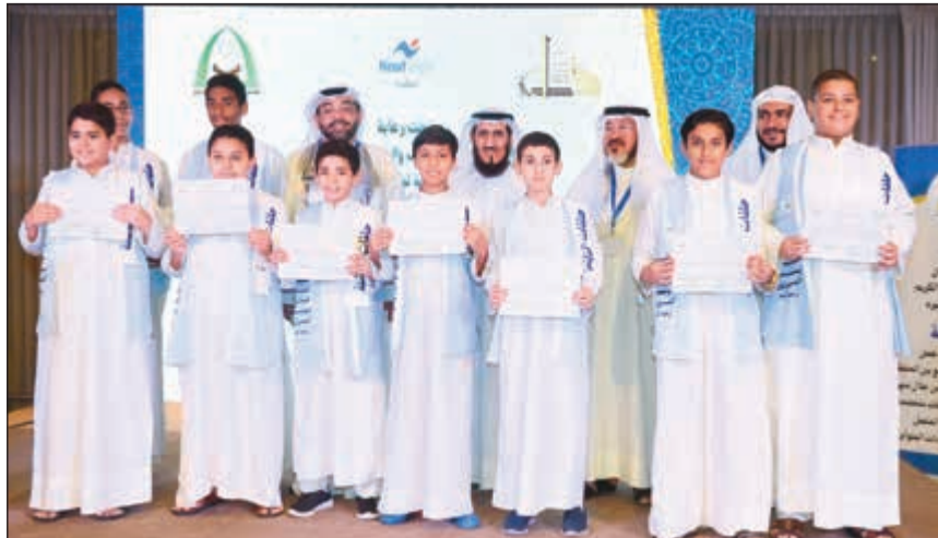
تكريم إحدى حلقات البراعم