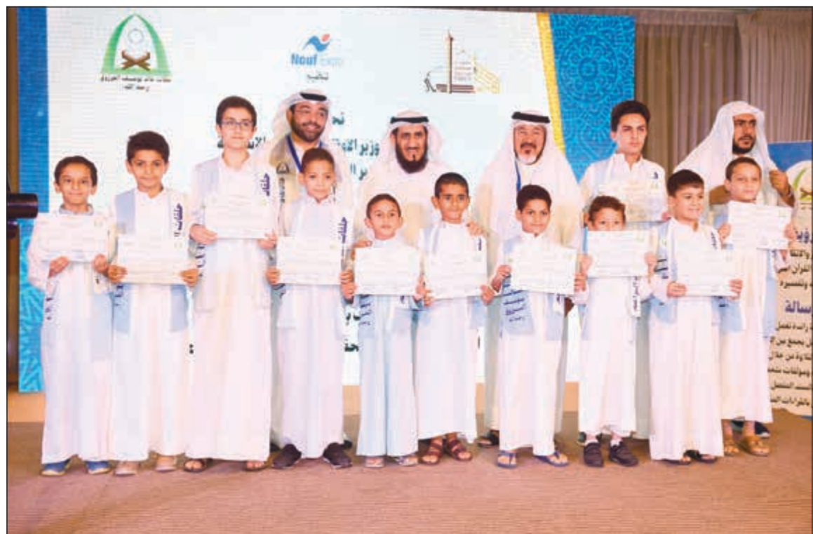
جانب من تكريم حفظة كتاب الله