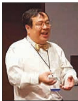
البروفيسور يومان فونغ

لدى البشر. وقد تم استخدام الفيروس، الذي يسبب البرد العام، في علاج سرطان الدماغ من قبل علماء في الولايات المتحدة، حيث شهد بعض المرضى اختفاء الأورام السرطانية لسنوات في حين تقلصت الأورام لدى آخرين. وكان شائعاً لدى العلماء منذ بدايات القرن العشرين أن الفيروسات تقضي على الأورام السرطانية، لكن كان هناك دوماً تخوف من سمية