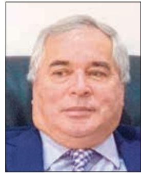
السفير زيد الله زيدوف

إلى الكويت بهدف تعزيز وتطوير العلاقات الاقتصادية وخصوصاً الجانب السياحي، حيث استقبلت طاجيكستان خلال هذا العام ما يقارب المليون سائح من مختلف دول العالم. ولفت إلى أن رئيس الوزراء الطاجيكي سيلتقي صاحب السمو الأمير الشيخ صباح الأحمد، وسمو ولي العهد الشيخ نواف الأحمد،