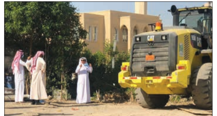
إزالة التعديات على أملاك الدولة في الجليب

بمواصلة عمليات إزالة التعديات على أملاك الدولة. وفي السياق ذاته، كثف مركز نظافة خيطان في إدارة النظافة العامة بالفروانية عمليات استبدال الحاويات القديمة بأخرى جديدة. كما قام الجهاز الرقابي بفرع بلدية الفروانية ممثلا في إدارة النظافة العامة والحساوي.