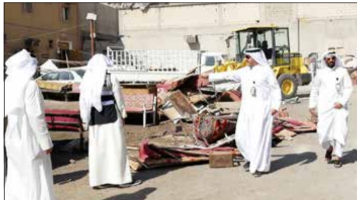
جانب من جولة البلدية في المنطقة