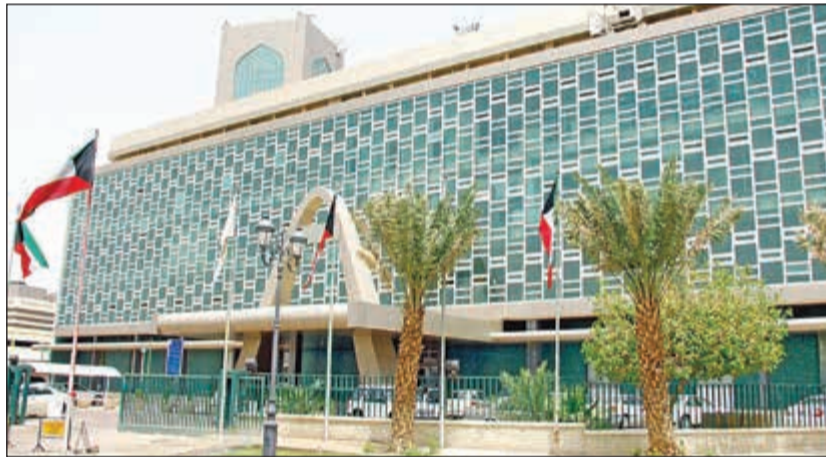
جهود البلدية مستمرة لتطبيق القانون

ورفع 182 إعلانا مخالفا بالشوارع والميادين، مشيرًا إلى أنه تم الكشف على 40 شكوى هاتفية وخطية تم التعامل معها، وتم إغلاق 3 محلات. ودعت إدارة العلاقات العامة الجمهور في حال وجود أي شكوى تتعلق بالبلدية إلى الاتصال على الخط المباشر 139 أو التواصل على حساب البلدية @kuwmmun عبر مواقع التواصل الاجتماعي وسيتم اتخاذ الإجراءات القانونية حيال الشكوى على الفور.