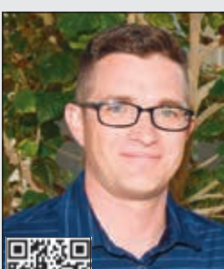
فيل إمبوري (أحمد علي)

مهر جان «اكتشف أميركا» احتفى بخريجي الجامعات الأميركية وبرامج التبادل الثقافي وسلط الضوء على إمكانات «أمريكان إنترناشيونال كولج» قائد فرقة سلاح الجو الأميركي فيل إمبوري لـ «الأنباء»: أحببت طعام وقهوة الكويت ونتجه للتعاون مع عازفين كويتيين