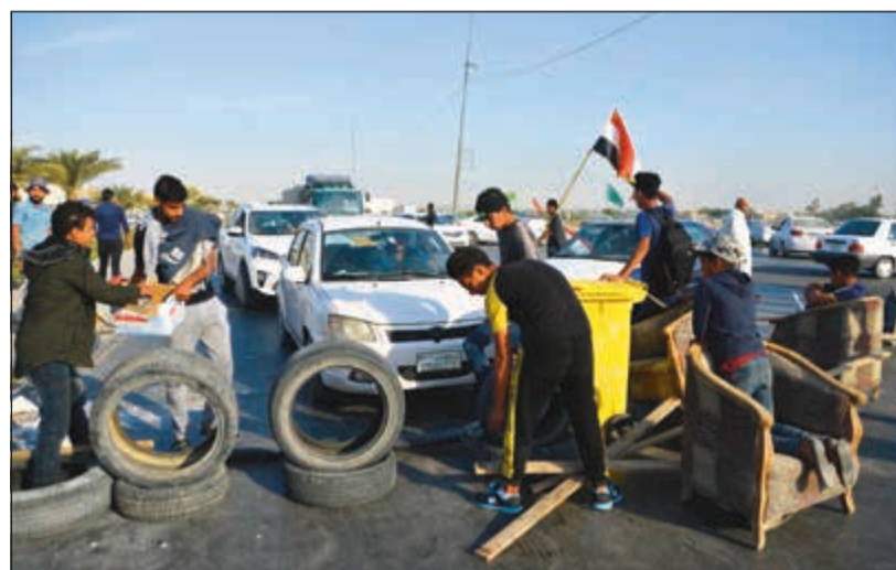
محتجون عراقيون يقطعون طريق مطار النجف خلال الاحتجاجات المتصاعدة في العراق

بغداد - وكالات: حذرت القوات المسلحة العراقية من أنها لن تسمح بإغلاق الجسور والطرق كونها ممراً حيويًا للسكان، بعدما أقدم متظاهرون على قطع جسر الشهداء وهو الرابع في بغداد أمس مع دخول الاحتجاجات يومها الرابع عشر، في وقت لا تزال خدمة الإنترنت مقطوعة بشكل تام في غالبية أنحاء البلاد. وقبل «الشهداء» أغلق المحتجون جسر «الجمهورية»، وجسري «السنك» و«الأحرار»، مؤكدين أن معركة قطع الجسور في إطار العصيان المدني المعلن، ولحماية كل الطرقات التي تؤدي إلى المتظاهرين في ساحة التحرير. وأكد الجيش العراقي وجود تعليمات صارمة بعدم استخدام الذخيرة الحية ضد المتظاهرين، لكنه حذر من أن مواقع التواصل الاجتماعي وما وصفه به «جيشو الإلكترونية» تستغل التظاهرات لتحريض الشباب. ورغم مواصلة قوات الأمن استخدام الرصاص