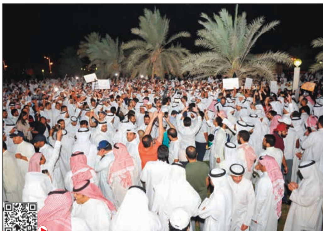
جانب من التجمع الاحتجاجي في ساحة الإرادة أمس

«الأولويات»: «التحقيقات» و«الشراكة» ودعم الأندية واللائحة متفق عليها مع الحكومة 09