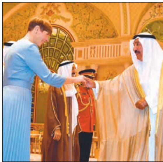
الشيخ جابر العبدالله مرحباً بالرئيسة كاليلويد