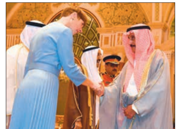
الشيخ ديارهيم الدعيج مصافحاً رئيسة إستونيا