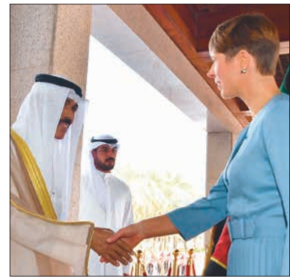
سمو ولي العهد الشيخ نواف الأحمد مستقبلاً رئيسة إستونيا