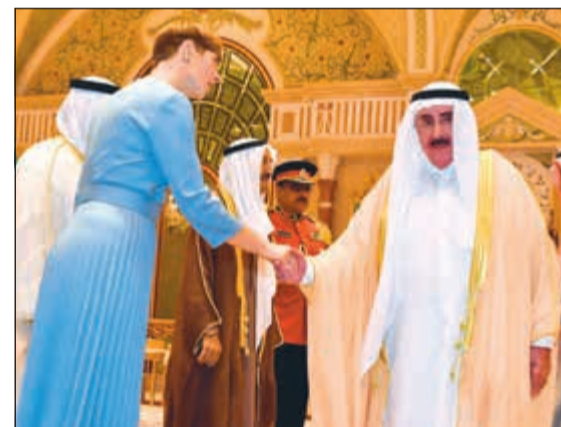
الشيخ سالم صباح الناصر مصافحاً رئيسة إستونيا