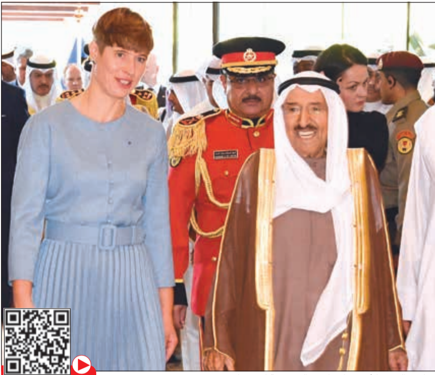
صاحب السمو الأمير خلال استقباله رئيسة إستونيا