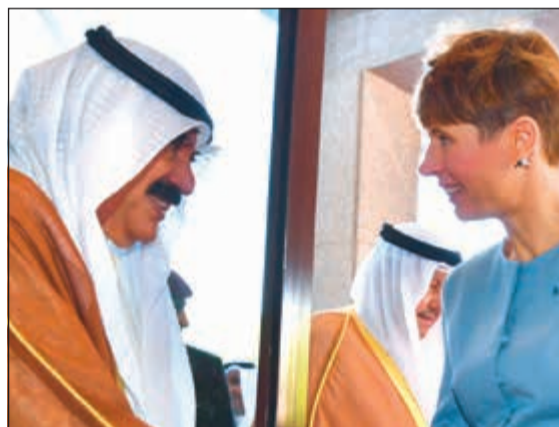
خالد الجارالله مرحباً بضيفه الكويت

هذا وقد عقدت المباحثات الرسمية بين الجانبين حيث ترأس الجانب الكويتي صاحب السمو الأمير الشيخ صباح الأحمد وسمو ولي العهد الشيخ نواف الأحمد وسمو رئيس مجلس الوزراء الشيخ جابر المبارك وكبار المسؤولين بالدولة. وعن جانب جمهورية استونيا الرئيسة كريستي كاليلويد وكبار المسؤولين في حكومة جمهورية استونيا.