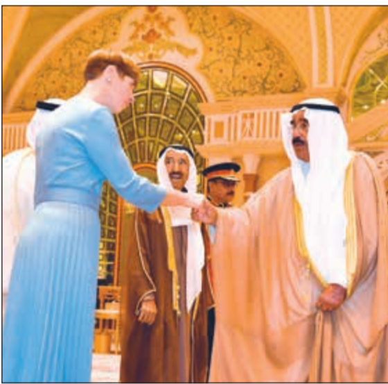
الشيخ فيصل السعود مصافحاً ضيفه الكويت