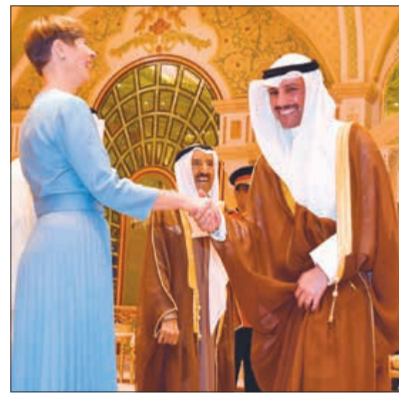
مرزوق الغانم مصافحاً رئيسة إستونيا