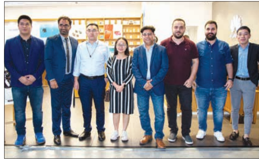
فريق عمل هواوي الكويت

الساعة ترتقي بإمكانات ومزايا الساعات الرياضية الذكية نحو آفاق جديدة