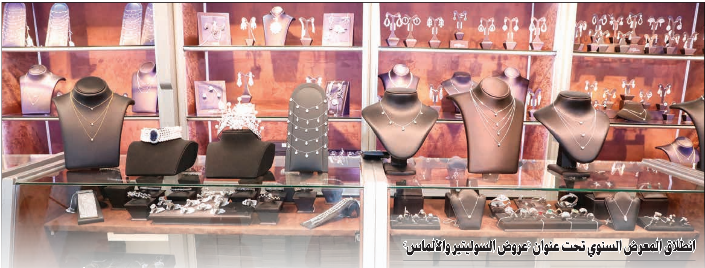
انطلاق المعرض السنوي تحت عنوان «عروض السوليتير والألماس»