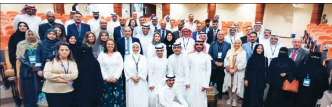
لقطة تذكارية مع الخبراء والمحدثين من الوطن العربي

العربية المفتوحة، المعهد العربي للتخطيط، برنامج الأمم المتحدة الإنمائي. ● تكون ريادة الأعمال والمشروعات الصغيرة ضمن استراتيجيات الدول، وأن تعطي الاهتمام اللازم. ● أن يكون هناك ملتقى نصف سنوي، ومؤتمر كل سنتين في الجامعة العربية المفتوحة - الكويت لراجعة أوضاع ريادة الأعمال وإنجازاتها وتحدياتها، وتقييم احتياجات التدريب وعرض نتائج البحوث الأكاديمية في هذا المجال. ● تقديم برامج استشارية وتركز على مساعدة المتفرجين وتطوير المنتجات وتقديمها ومهارات التواصل لدى المعنيين. ● التواصل من قبل الجامعة العربية المفتوحة واتحاد المدربين العرب مع الجهات الحكومية باسم رواد الأعمال لتجاوز العقبات. ● أن تكون صناديق الزكاة والمؤسسات وجمعيات النفع العام والبرلمان ورواد الأعمال إلى ترجمة توصيات المؤتمر على أرض الواقع.