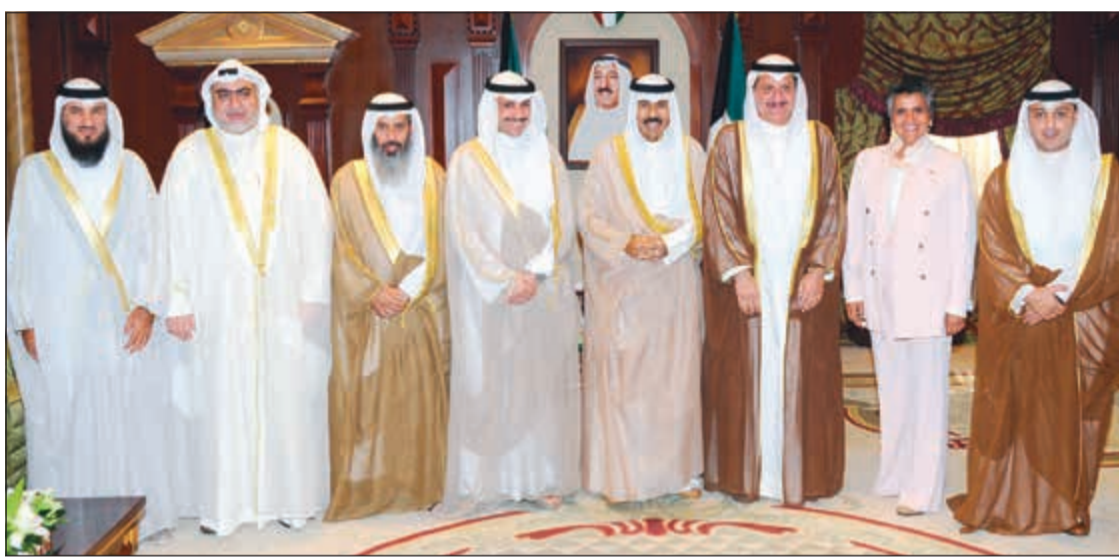
سمو ولي العهد الشيخ نواف الأحمد خلال استقباله مرزوق الغانم وأعضاء مكتب المجلس