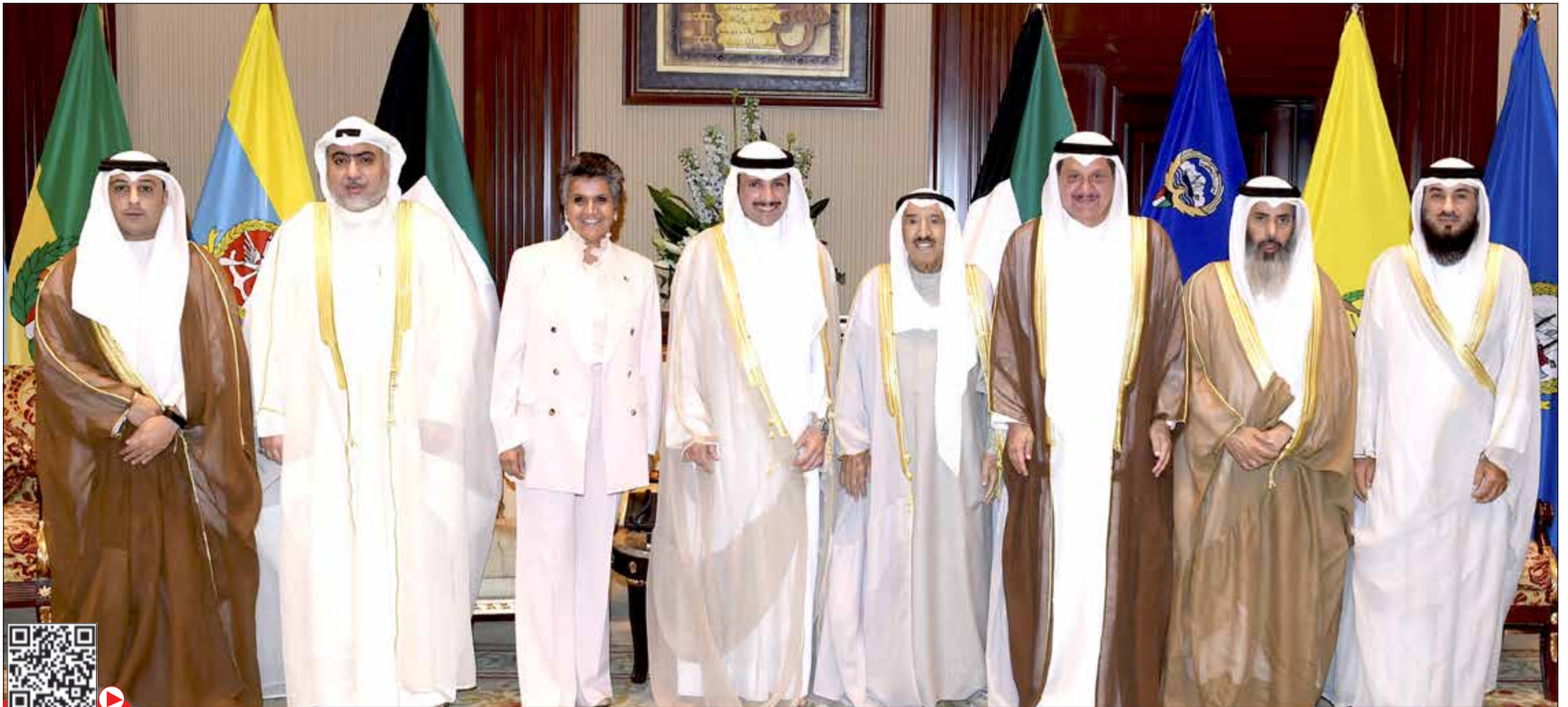
صاحب السمو الأمير الشيخ صباح الأحمد مستقبلاً رئيس مجلس الأمة مرزوق الغانم وأعضاء مكتب المجلس نايف المرداس وعيسى الكندري وصفاء الهاشم وخالد الشطي وأحمد الفضل وعلام الكندري