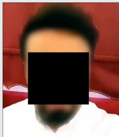
صاحب المسابقة ضبط بعد حصول الباحث على إذن قانوني

أبلغ مصدر أمني «الانباء» بأن إدارة الجرائم الإلكترونية تلقت بلاغاً من مواطن بشأن شخص مجهول اعتاد تصوير نساء خلسة خلال تسوقهن بمفردهن وصحبة ابناهن داخل الأسواق والمجمعات ومن ثم يقوم بتركيب أغاني بعضها غير لائق ويحمل سخرية في أحيان عدة. وقال المصدر: تلقينا إلى جانب البلاغ مقاطع قام