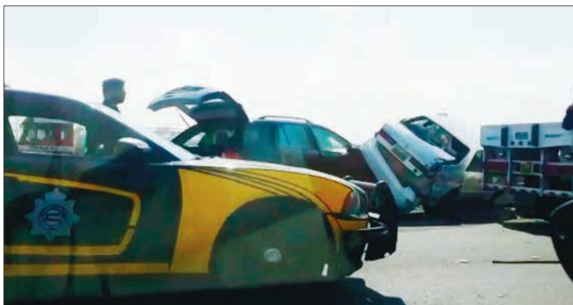
مركبة صعقت على أخرى واستقرت على الحاجز الإسمنتي