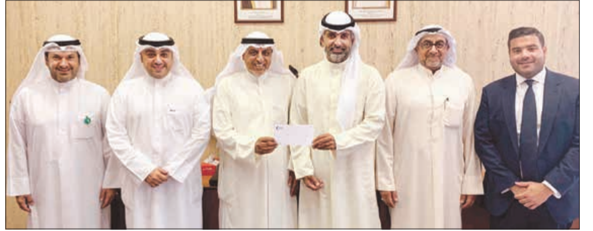
خلال تسليم الدعم المادي المقدم من البنك لصندوق حماية البيئة

وبهذه المناسبة، سيحصل جميع موظفي البنك وعملائه من الرجال خلال شهر نوفمبر على خصم بنسبة 30% عند إجراء فحص PSA مع مجموعة جلوبال الطبية في برج مزيا - ميد كلينك في