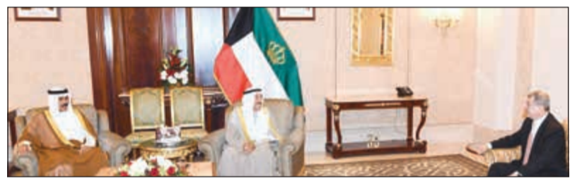
صاحب السمو الأمير مستقبلا السفير العراقي علاء الهاشمي بحضور سمو ولي العهد

عبر فيها سموه عن خالص تعازيه وصادق مواساته بوفاة والدته، وبعث سمو ولي العهد بالتحية والتأييد إلى الرئيس مونغ جيه إن رئيس جمهورية كوريا الصديقة ضمنها سموه خالص تعازيه وصادق مواساته بوفاة والدته، كما بعث سمو الشيخ جابر المبارك رئيس مجلس الوزراء ببرقية تعزية مماثلة من جهة أخرى،