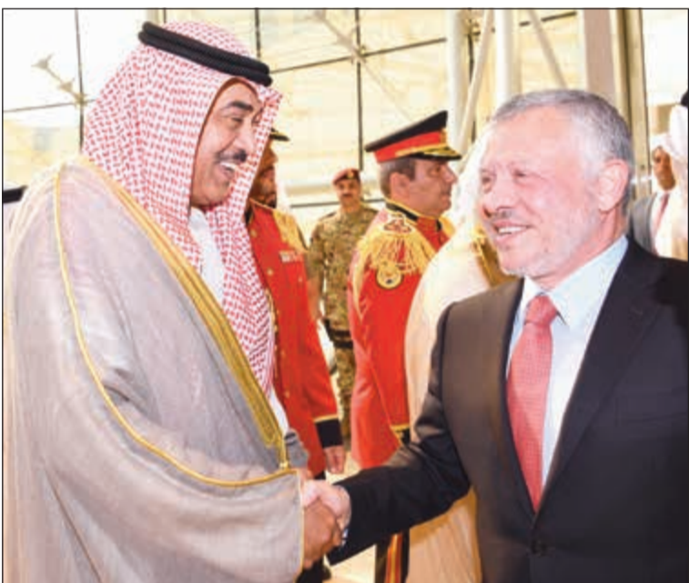
العاهل الأردني مصافحا الشيخ صباح الخالد