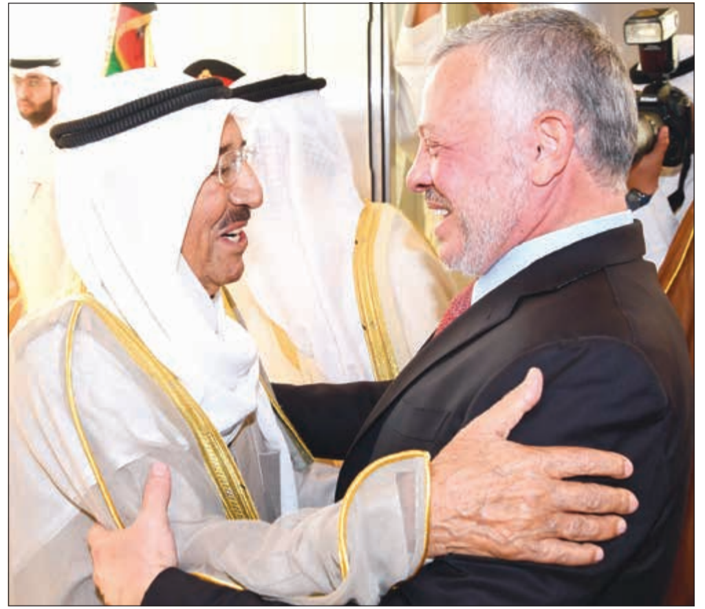
صاحب السمو الأمير الشيخ صباح الأحمد مرحبا بالعاهل الأردني الملك عبد الله الثاني

صاحب السمو بحث مع الملك عبدالله العلاقات الأخوية المتميزة بين البلدين وسبل تعزيزها وتنميتها في كل المجالات والمستجدات الإقليمية والدولية