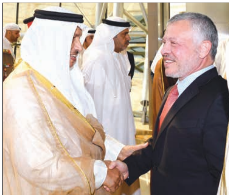
سمو الشيخ جابر المبارك مرحبا بملك الأردن