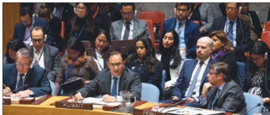
السفير منصور العتيبي خلال جلسة مجلس الأمن

الاستجابات الإنسانية مع احتياجات النساء والفتيات بشكل كافٍ والتمثيل المنخفض للمرأة في العمليات السياسية وعمليات السلام والمناصب القيادية. تصادف حلول الذكرى السنوية للعديد من الأطر المرجعية والمناسبات المهمة مثل الاحتفال بمرور 75 عاماً على إنشاء الأمم المتحدة و25 عاماً على اعتماد إعلان ومنهاج عمل بكين و20 عاماً على اعتماد قرار مجلس الأمن 1325 (2000).