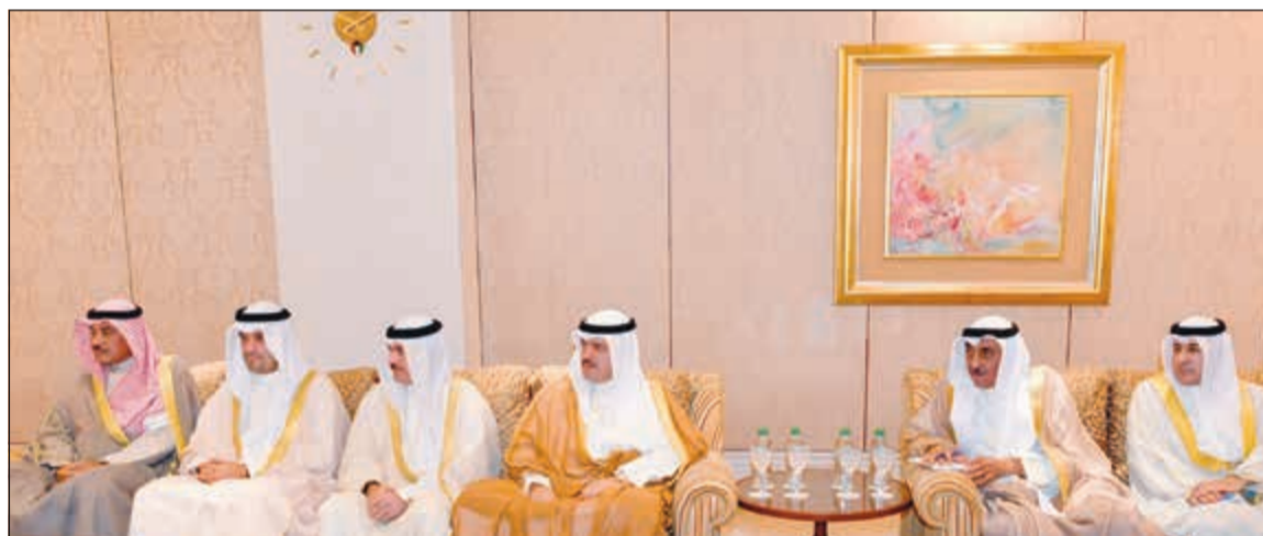
الشيخ صباح الخالد وأنس الصالح والشيخ خالد العبد الله والسفير فهد العوضي والسفير عزيز الديجاني

استقبل صاحب السمو الأمير الشيخ صباح الأحمد بالمطار الأميري صباح أمس سمو ولي العهد الشيخ نواف الأحمد، كما استقبل سموه الوزراء الشيخ جابر المبارك، واستقبل صاحب السمو الأمير صباح أمس وبحضور سمو ولي العهد الشيخ نواف الأحمد، استقبال سموه سفير جمهورية العراق علاء الهاشمي، وذلك بمناسبة انتهاء فترة مهام عمله سفيراً للبلاد، من جانب آخر، بعث صاحب السمو الأمير الشيخ صباح الأحمد ببرقية تعزية إلى الرئيس مونغ جيه إن رئيس جمهورية كوريا الصديقة