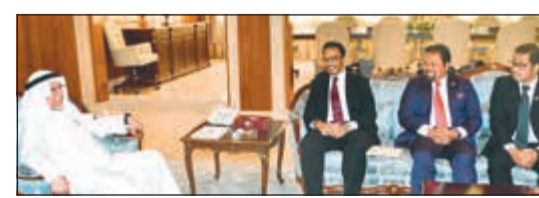
الشيخ علي الجراح يتسلم رسالة خطية من مبعوث رئيس وزراء ماليزيا