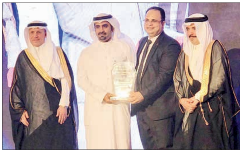
خلال تكريم الخطوط الجوية السعودية لشركة صفا

وأضاف أن شركة صفا تتعامل مع مئات الفنادق الفاخرة في كل من مكة المكرمة والمدنية المنورة، وتقدم خدماتها سنوياً لآلاف المعتمرين، ولديها آلاف عمليات الحجز سنوياً لآلاف رحلات الطيران، إضافة إلى وجود 450 ألف متابع عبر مواقع التواصل الاجتماعي. وفي معرض حديثه عن إنجازات الشركة أفاد الحرفش بأن شركة صفا تمتلك أحدث الوسائل التكنولوجية في مجال الحجز والدفع عبر بوابات الدفع الإلكترونية المتعددة من خلال موقعها الإلكتروني وتطبيقها الحديث على الهواتف الذكية الذي سيجلب قريباً، وذلك بالتنسيق مع جميع بوابات الدفع الإلكترونية العاملة في دول مجلس التعاون الخليجي والعالم، كما أنشأت مركزاً متميزاً لخدمة العملاء يعمل على مدار الساعة. وأوضح الحرفش أنه بعد أن خطت الشركة خطوات رائدة في الكويت في الرقي بخدمات ضيوف الرحمن، فإنها بصدد نقل تجربتها الفريدة إلى دول عدة، حيث افتتحت