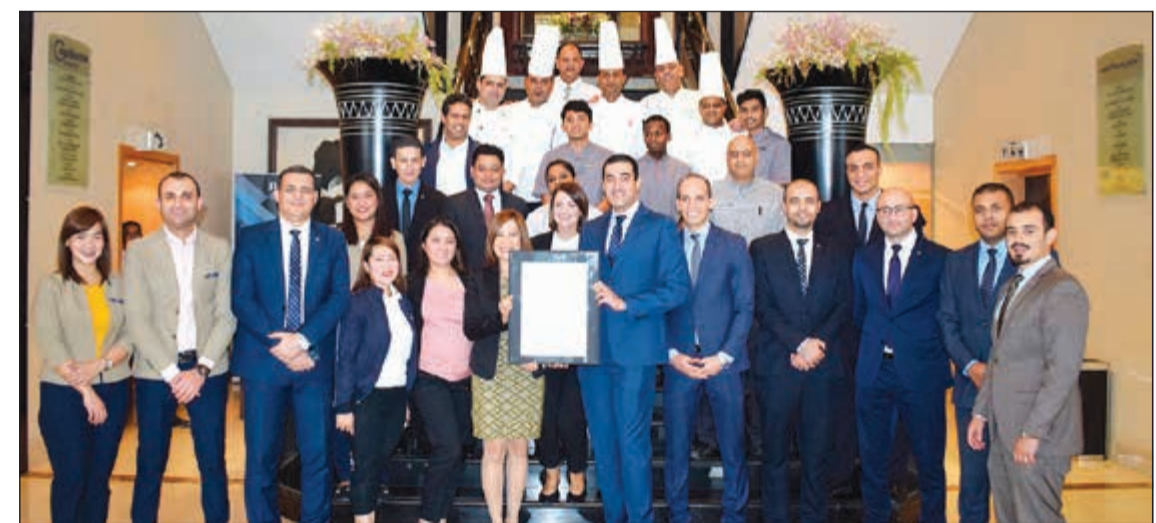
فريق «كوبثورن الكويت» خلال الاحتفال بالجائزة

بالشكر إلى جميع أفراد فريق عملنا المحترف الذي كان له الدور الأساسي في تنويعنا بهذه الجائزة التي تصنفنا كأفضل فندق عائلي فاخر لعام 2019». ويشارك بالتصويت كل عام أكثر من 300,000 مسافر حول العالم لمدة 4 أسابيع لتحديد الفائزين في «جوائز الفنادق العالمية الفائزة»، وهيئة جوائز الفنادق العالمية الفائزة هي منظمة عالمية مختصة في تصنيف الفنادق العالمية بمختلف فئاتها، وتكريمها للفنادق التي تتمتع بمرافق فاخرة وخدمات مرموقة، وتعتبر هذه الجوائز الدولية التي تأسست عام 2006 أحد أهم المنصات الدولية التي تكرم وترتقي بمعايير قطاع الضيافة الفندقية الفاخرة.