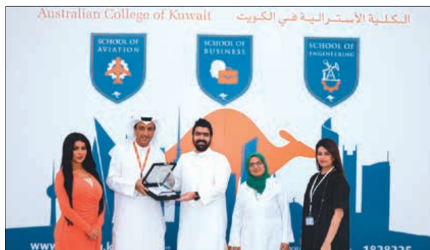
تكريم المشاركين في الحملة