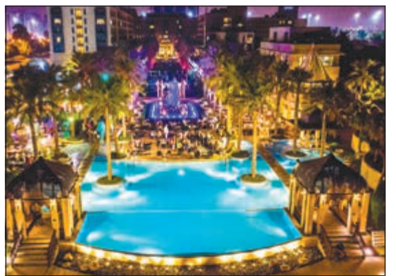
أجواء مميزة في جميرا