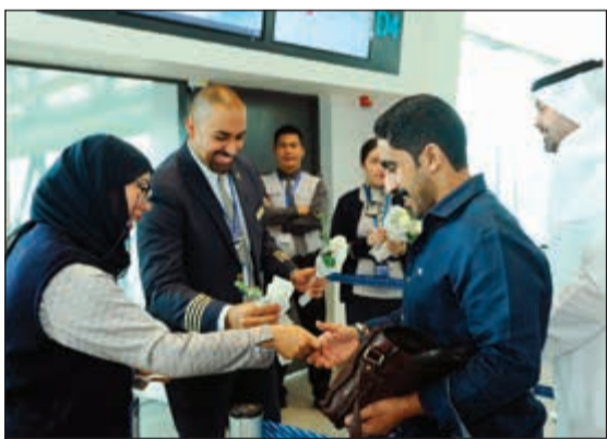
جانب من توديع المسافرين على رحلة القصيم

المملكة العربية السعودية الشقيقة ولكثرة تردد الزيارات بينهم. وأضاف: الكويتية لوجهة القصيم بعد دراسات تسويقية متأنية وضمن خطط حصفية لهذه الوجهة ولما لها من أهمية لدى ركاب الشركة وعمالها الكرام ولتلبية الطلب المتنامي على الوجهات الخليجية المهمة، حيث أن الخطوط الجوية الكويتية تحرص كل الحرص على توفير خيارات متنوعة ومختلفة تناسب احتياجات ومنطلقات ركابها الأعداء، كذلك فإن افتتاح وجهة القصيم جاء ضمن الخطط الاستراتيجية التي انتهجها مجلس الإدارة في توسيع شبكة خطوط الشركة والسعي وراء الدخول في أسواق مختلفة ومطلوبة في الوقت ذاته.