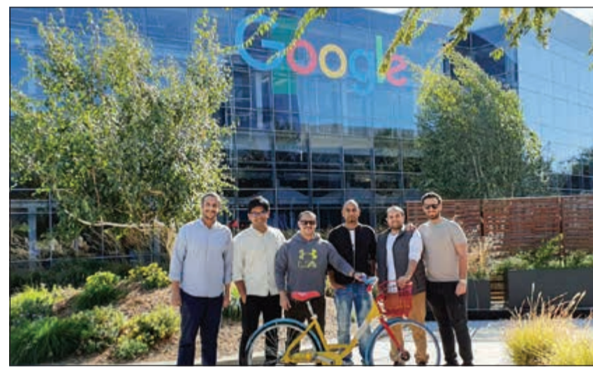
الفريق الفائز أمام شركة Google

نظم أول هاكاثون من نوعه لوظائفه بهدف إلى دعم الابتكار والإبداع بالتعاون مع منصة Plug and Play العالمية وذلك في إطار حرص إدارة البنك على الارتقاء بمستوى جميع العاملين في البنك بما ينعكس إيجابا على مستوى منتجات وخدمات البنك وخدمة العملاء. وقد شمل الهاكاثون محاولات لحل إشكالية محددة أو لابتكار شيء جديد أو مميز في إطار زمني محدد، حيث يعطي الهاكاثون الفرصة لأشخاص بمهارات مختلفة ومن اختصاصات متنوعة للعمل معا وتطوير حلول في إطار زمني قصير، بعدها تقوم لجنة بتقييم نتائج هذا العمل.