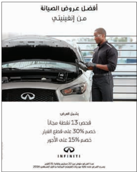
أفضل عروض الصيانة من إنفينيتي