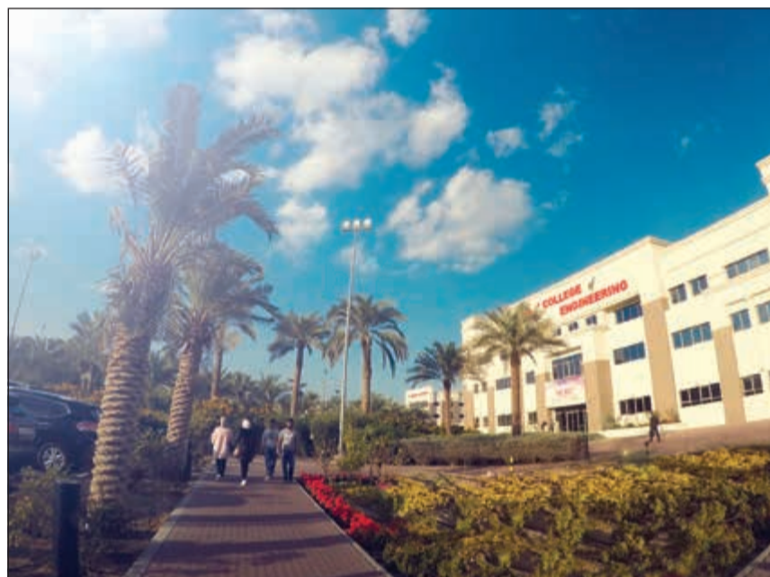
كلية الهندسة والتكنولوجيا

أبهر خبر انضمام جامعة AUM الكويتية إلى عضوية مركز CMS - CERN الأوساط الأكاديمية والعلمية في البلاد، كيف تم التحضير لهذه الخطوة؟