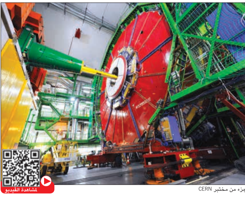
جزء من مختبر CERN

و ضمان وجود الشعب اللازمة لذلك. ووجود مراكز التقوية سواء لكل المواد أو سواء للكتابة الأكاديمية عبر مراكز متخصصة تدار من قبل الهيئة التعليمية وتقدم خدماتها مجاناً للطلبة على مدار الساعة. ووجود المراكز البحثية والأندية المتخصصة التي تحاكي سوق العمل وصناعاته المختلفة من التجهيزات المختلفة. شؤون الطلبة التي تضمن انجاز معاملات الطلبة والاستماع لمقترحاتهم وهمومهم بجد من الحرية الأكاديمية المترتبة. وهناك مراكز المشاريع الأكاديمية المتخصصة التي تدار من قبل الهيئة التعليمية.