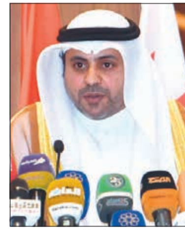
الوزير محمد الجبري يلقي كلمته

اعوجاجات هذا المجال الحيوي والمؤثر في كافة اطراف المجتمع ومستقبله. وأشارت الى ان التغيير الحقيقي يحدث فقط حين تكون الكلمة فعلاً لا قولاً مرهفاً منمقا منخرقاً بين جدران قاعات المؤتمرات.