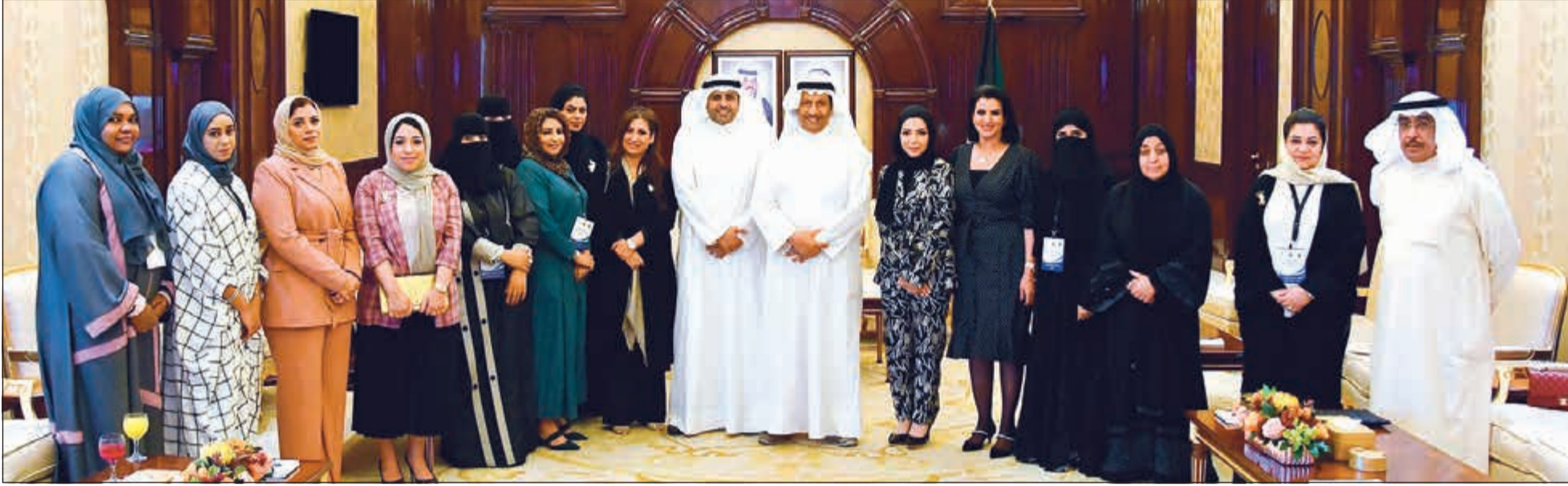
سمو رئيس الوزراء الشيخ جابر المبارك مستقبلاً محمد الجبري وعدنان الراشد والوفد الإعلامي المشارك في ملتقى الصحافيات الخليجيات الثالث لدول مجلس «التعاون»

استقبل سمو رئيس مجلس الوزراء الشيخ جابر المبارك وبحضور وزير الإعلام ووزير الدولة لشؤون الشباب محمد الجبري أمين سر جمعية الصحافيين عدنان الراشد والوفد الإعلامي المشارك في ملتقى الصحافيات الخليجيات الثالث لدول مجلس التعاون لدول الخليج العربية 2019. وأشاد سموه بالجهود التي تقوم بها المرأة الخليجية في تطوير الإعلام بمختلف وسائله، مؤكداً الدور البارز الذي تقوم به في المجال الإعلامي، لا سيما في نشر الوعي والثقافة ودفع جهود التنمية وإظهار الصورة المشرفة للمجتمع. حضر المقابلة رئيس ديوان رئيس مجلس الوزراء الشيخة اعتماد الخالد.