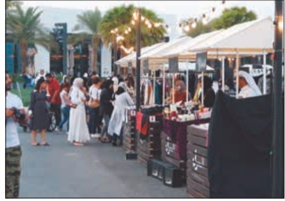
جانب من السوق