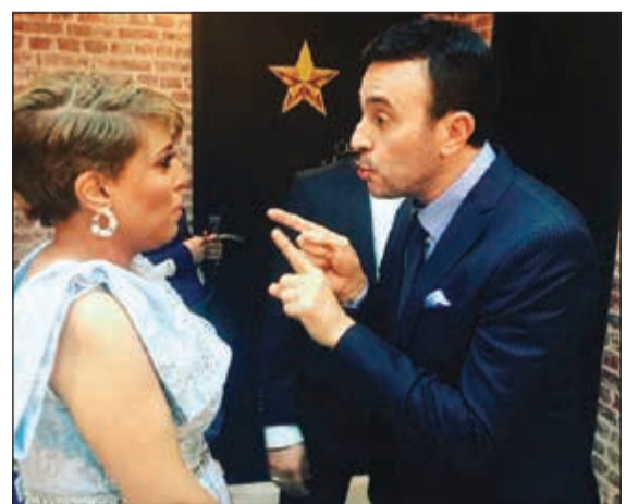
غزوة تستمع لنصائح المطرب صابر الرباعي في كواليس «الزمن الجميل»