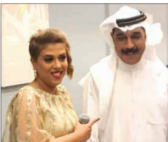
.. ومع النجم عبدالله الرويشد

كانت شفوية وغير جادة. وعن الأصوات الكويتية التي تستمع إليها، قالت: نحن في تونس تربينا على أصوات نبيل شميل وعبدالله الرويشد ونوال الكويتية ومن الخليج محمد عبده والراحل طلال ملاح. وحول سبب عدم مشاركتها في برنامج اكتشاف المواهب مثل «أراب أيدول» و«ذا فويس»، أوضحت: أنا فنانة محترفة في تونس ولست هاوية، وبداتي كانت وأنا عمري 12 سنة، حيث كان أول ظهور لي في التلفزيون التونسي وشاركت في برامج غنائية تونسية مثل برنامج «طريق النجوم» في موسمه الأول والذي شهد انطلاقتي الفنية، وغنيت في مساح ومهرجانات كثيرة في تونس، وحصلت على العديد من الجوائز، منها حصولي على المركز الأول والجائزة الكبرى عام 2008 في مهرجان الأغنية التونسية بعد أن شاركت بقصيدة «أنا لا أنام» من كلمات مدير بيت الشعر في تونس الشاعر منصف المرزني والحن محمد عليا، كما شاركت في سلسلة غنائية تقام كل عام في ليبيا، وكشفت غزوة بن ابراهيم عن أنها بجانب الغناء الطربي، فهي منشدة دينية لها العديد من الأناشيد والأناشيد.