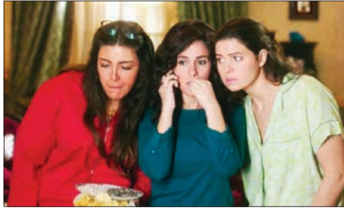
.. وفي مشهد من مسلسل «بنات سوبر مان»