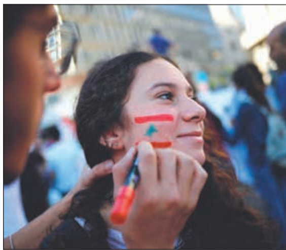
متظاهرة ترسم علم لبنان على وجهها