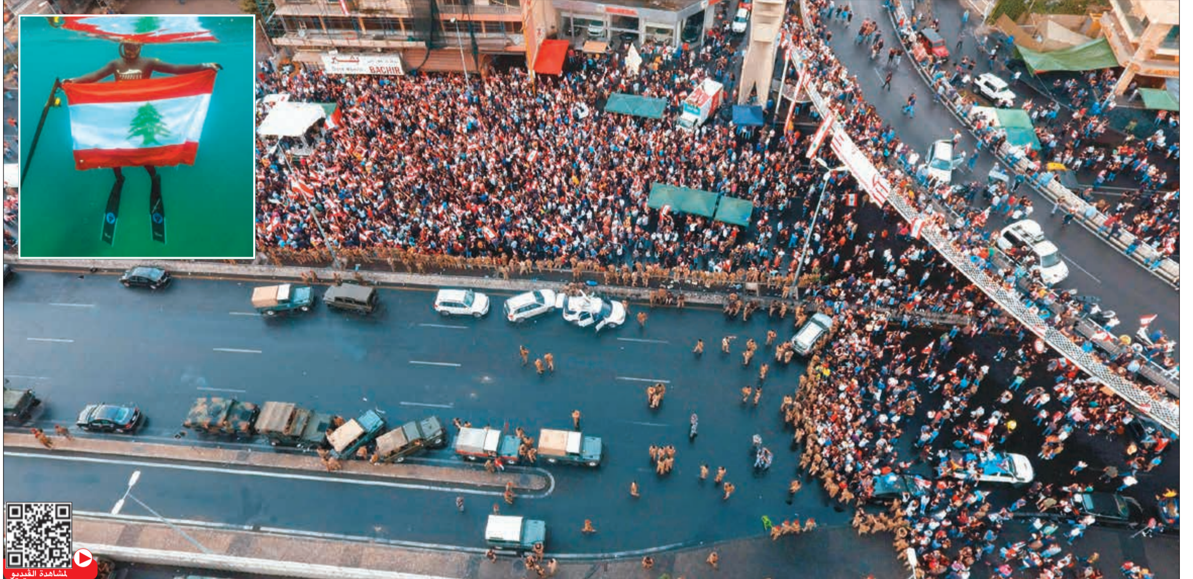
صورة جوية لمظاهرات لبنانيين يتجمعون على الطريق الدولية جوية - بيروت

على وحدة الشعب والجيش في مواجهة التهديدات بروح وطنية جامعة.