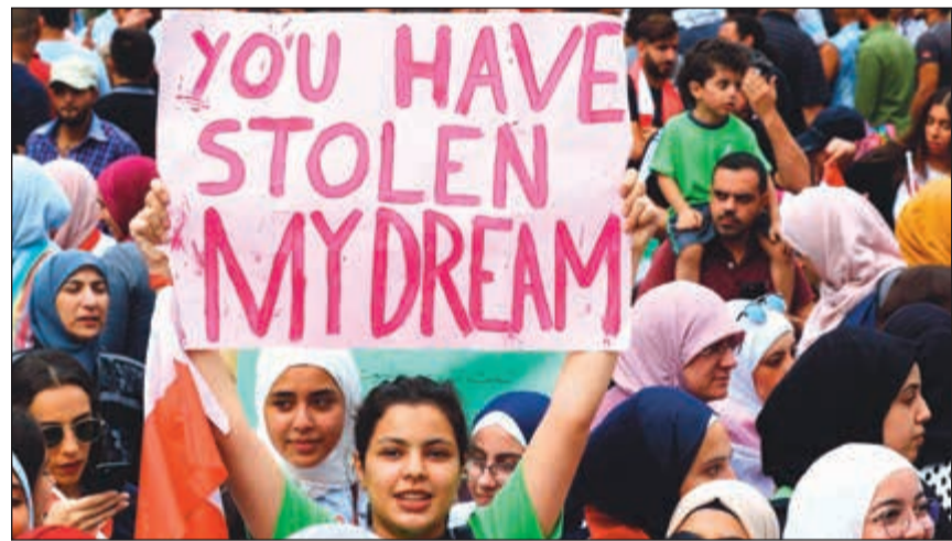
متظاهرة لبنانية تحمل لافتة تتهم السلطة بسرقة حلمها

اعتبر رئيس مجلس النواب نبيه بري، ان الظرف الحالي موات لقيام الدولة المدنية وإعداد قانون للانتخابات النيابية يعتمد لبنان دائرة واحدة على قاعدة النسبية. وقال النائب علي بزي نقلاً عن بري في لقاء الأربعاء الأسبوعي النيابي، ان مطالب الحراك في الجانب الاقتصادي كانت ضمن جملة البنود الـ 22 الإصلاحية التي أقرتها الحكومة أخيراً.