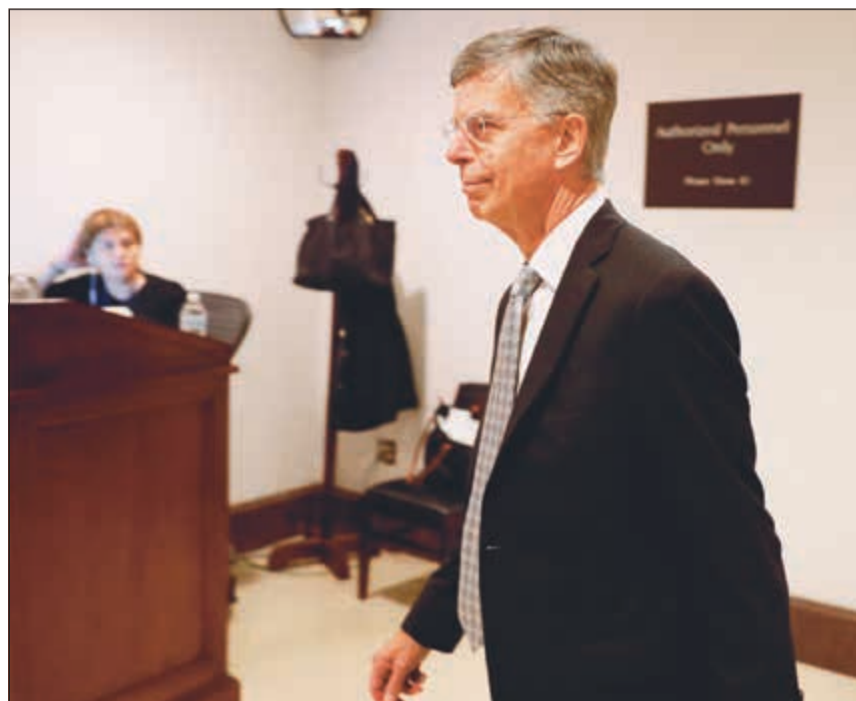
لقائم بأعمال السفارة الأميركية في أوكرانيا بيل تايلور لدى وصوله الكونغرس قبيل الإقالة بشهادته أمس الأول

ورأى الديموقراطيون في مجلس النواب في شهادة تايلور دليلاً على أن الشبهات التي دفعتهن إلى بدء إجراءات اتهام وعزل ضد ترامب، لها أساس من الصحة. وشدد العديد من النواب الديموقراطيين على قوة هذه الإفادة، وكتب اديانو ايسابايا في تغريدة على تويتر «ما سمعته من بيل تايلور مقلق جداً»، بينما رأته ديبى واسرمان شولتز أنها «ببساطة أكثر شهادة مثيرة للقلق سمعتها حتى الآن». ولم يرد ترامب بشكل مباشر على شهادة تايلور،