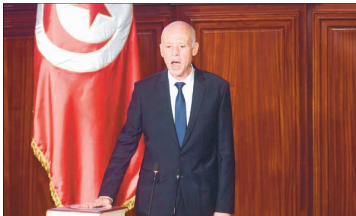
الرئيس التونسي الجديد قيس سعيد خلال أدائه اليمين الدستورية أمس

يوتهم البعض بالتقادم، لأن فلسطين ليست مجرد قطعة أرض بل سبقي في وجدان كل مواطن تونسي ومنقوشة في صدره. وسيكون أمام الرئيس الجديد مهلة أسبوع لتكليف رئيس الحزب الفائز بأكثر المقاعد في البرلمان بتشكيل حكومة في أجل أقصاه ستين