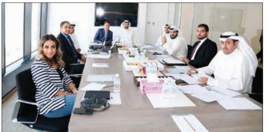
جانب من اجتماع جمعية حملة وحدات صناديق شركة الوفرة للاستثمار

عقدت شركة وفرة للاستثمار الدولي اجتماع جمعية حملة وحدات الصناديق التي تديرها الشركة، وذلك في مقرها الرئيسي أمس، حيث تمت مناقشة جميع بنود جدول الأعمال.