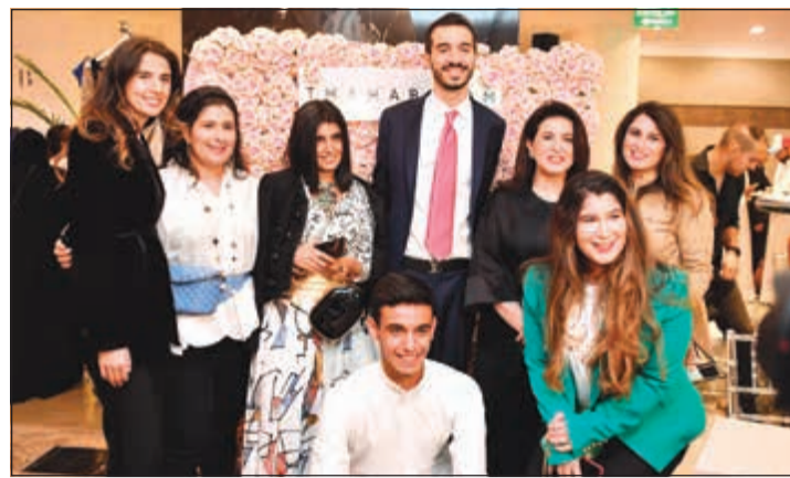
سسارة وفراس أبو شعر مع الشبيخة عزة جابر العلي الصباح والشيخة هيا الصباح والشيخة موضي الصباح والشيخة سارة الصباح وسارة الوزان وعبد العزيز البحر