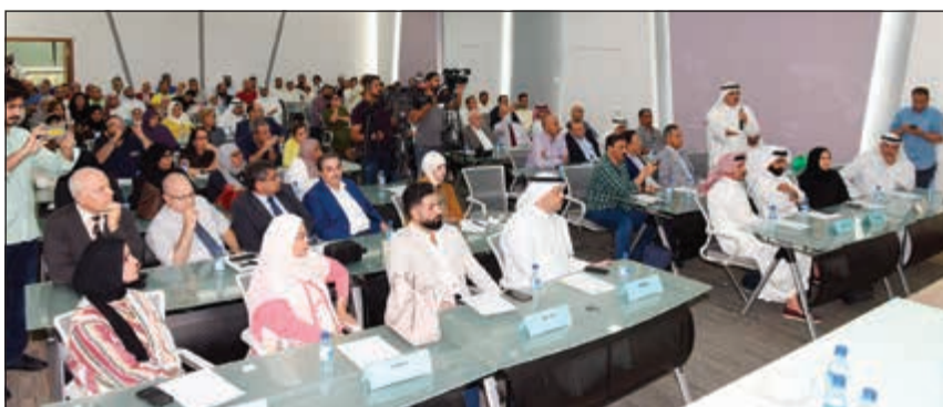
جانب من الحضور خلال المؤتمر الصحافي

المهنة الإنسانية، منوها إلى أن المؤشرات غير مطمئنة على الرغم من وجود جهود واضحة من الجمعيات الطبية ووزارة الصحة ممثلة بالوزير د.باسل الصباح لحل هذه الأزمة. وذكر د.العنزي أن التدقيق على صحة الشهادات والمعادلة مطبقة وبشكل أفضل وأدق بكثير من المزمع تطبيقه عن طريق التعليم العالي، والتي ليس لديها الطاقة الاستيعابية المناسبة للمعادلات، بحيث إن وزارة الصحة استخدمت EPIC وهي مؤسسة عالية غير ربحية ذات مصداقية عالية جدا يعتمد عليها دول أميركا وأوروبا في التحقق من الشهادات، بالإضافة إلى ضوابط فنية عالية الجودة مثل الاختبارات والمقابلات والعمل تحت الرقابة للتأكد من مهنية المعينين الجدد، إن لم يعمل أي طبيب إلا بعد التدقيق من صحة البيانات.