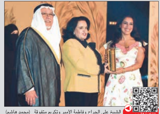
الشيخ علي الجراح وفاطمة الأمير وتكرّم متفوقة (محمد هاشم)

علي الجراح في حفل تكريم أبناء الشهداء المتفوقين: اكتساب المعرفة لبناء كويت المستقبل 13