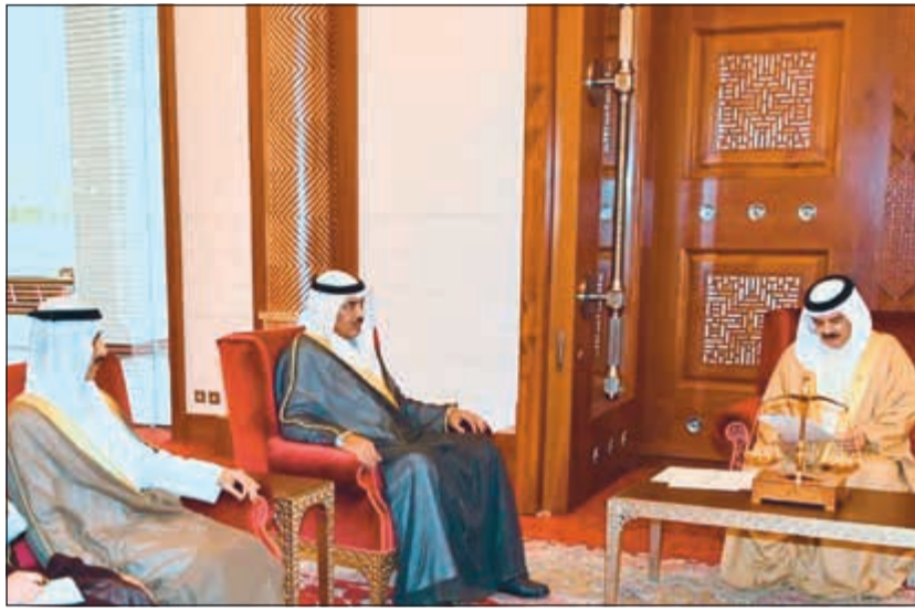
عاهل البحرين الملك حمد بن عيسى خلال استقباله الشيخ صباح الخالد بحضور الشيخ ثامر الجابر