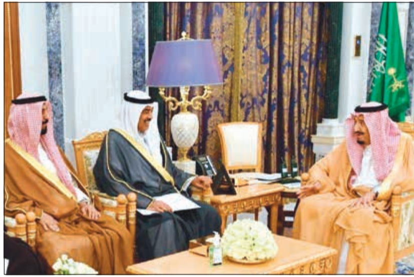
خادم الحرمين الشريفين الملك سلمان بن عبدالعزيز خلال استقباله الشيخ صباح الخالد والشيخ علي الخالد