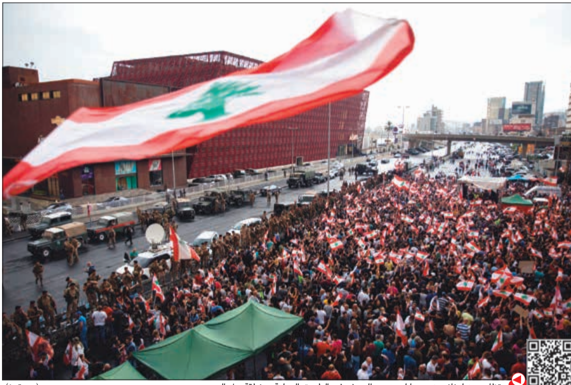
مظاهرون لبنانيون وجهوا لوجه مع الجيش في الطريق الدولية بمنطقة جبل الديب