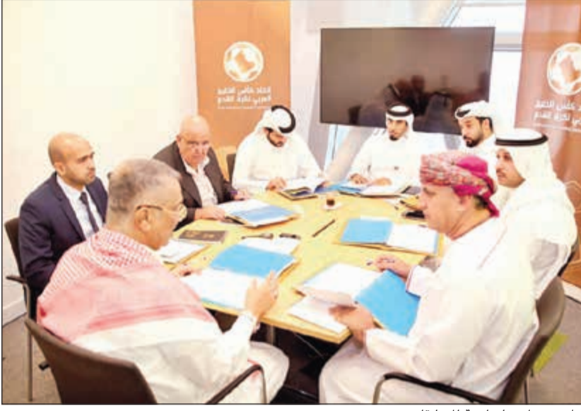
جانب من اجتماع لجنة المسابقات

«خليجي 24». وقال الخرساني إن القرعة ستقام اليوم بحضور دول الكويت، والعراق، وسلطنة عمان، وقطر. هذا، واعتمدت لجنة المسابقات باتحاد كأس الخليج العربي، في اجتماعها بالدوحة، ستاد خليفة الدولي لإقامة مباريات منافسات البطولة.