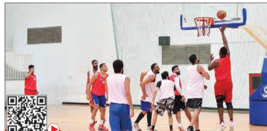
جانب من تدريبات الأزرق خلال الفترة المسائية بنادي النصر