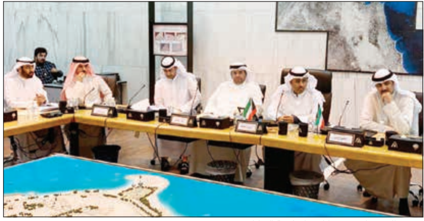
مشغل الحمضان مترسدا اجتماع لجنة الشكاوى

المستغلة بسبب ممارسة المهنة بدون ترخيص، ما كان له اثر كبير على الهيئة فضلا عن التداخل بعمل الشركات المختصة بهذا المجال، مشيرا الى انه تمت احالته الى الجهاز التنفيذي وهيئة البيئة لرفع تقرير لبيان المتجاوزين على القانون. وقال انه تمت مناقشة شكوى أهالي غرناطة بشأن قطعة 1 حيث تم تخصيصها روضة اطفال بالقطعة 1 والمشاكل المرورية التي تسببت بها الروضة في حال تنفيذها حيث تمت احالة الطلب الى الجهاز التنفيذي بوزارة التربية والمرور لرفع تقرير معرفة ملائمة هذا الموقع، ومدى تأثيره على الحركة المرورية بالمنطقة.