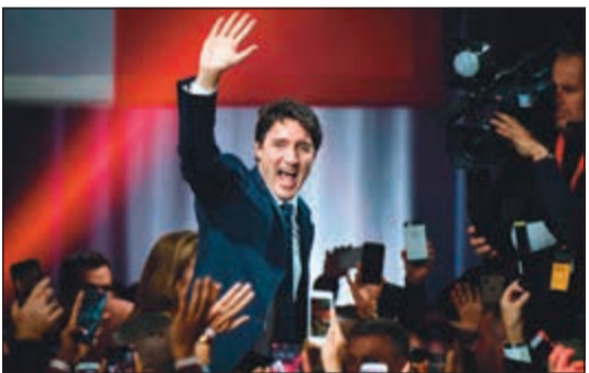
جاستن ترودو يحتفل بفوزه في الانتخابات البرلمانية

مونتريال - أ.ف.ب: فاز رئيس الوزراء الكندي جاستن ترودو بولاية ثانية، لكن حزبه الليبرالي حصل على غالبية ضئيلة في البرلمان ما سيرغمه على البحث عن تحالفات للبقاء في الحكم. وبحسب تقديرات أولية، فاز الليبراليون بـ 156 مقعداً من أصل 338 في مجلس العموم الكندي، بعد أن خسروا غالبية مريحة من 177 مقعداً في البرلمان السابق. وقال ترودو أمام مناصريه الذين تجمعوا في وسط مونتريال «فعلتموها يا أصدقائي، تهانتي». وأضاف «هذا المساء، رفض الكنديون الانقسام، رفضوا خفض الضرائب والتكشف وصوتوا لصالح برنامج تقديمي وخطوة قوية ضد التغيير المناخي». ورغم الفضائح الكثيرة التي اتسمت بها سنواته الأربع في الحكم، ومنها تنكره بزي رجل أسود في إحدى الحفلات الجامعية، ربح ترودو دعم حزب صغير، يربح أن يكون الحزب الديمقراطي الجديد بزعامه جاغيميت سينغ.